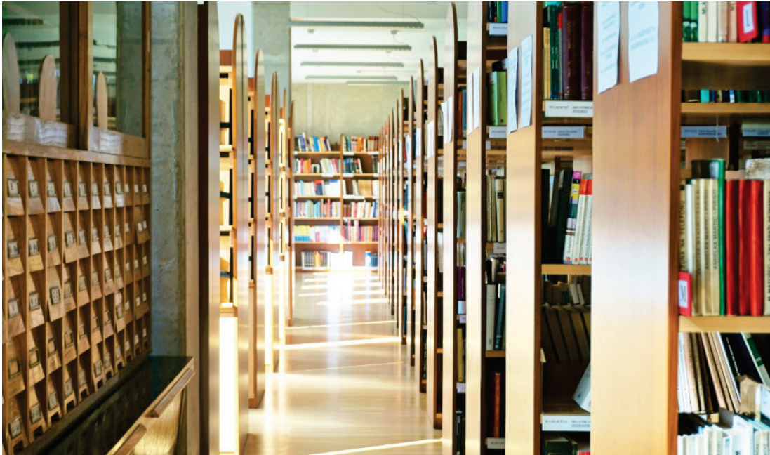
Slika 5. Fond Knjižnice