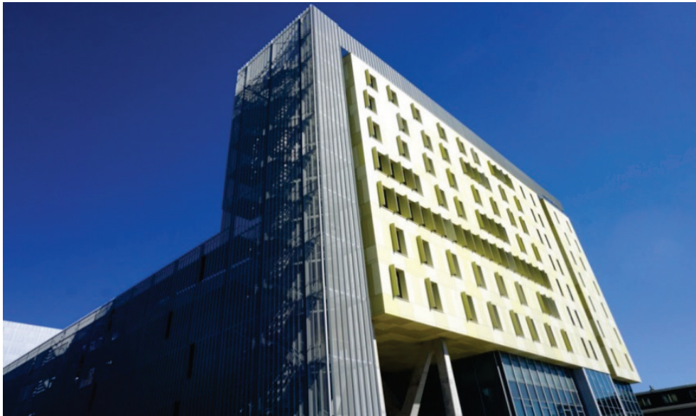
Slika 1. Zgrada Filozofskog fakulteta u Rijeci, Sveučilišna avenija 4

Knjižnice (slika 4 i 5) broji 85.196 jedinica građe 1 , a sastoji se od monografskih (76.391) i periodičnih publikacija (7.256), magistarskih i doktorskih radova (916) i elektroničke građe (633). Stvarno stanje fonda utvrđeno je akademske 2016./2017. godine, kada je okončana revizija cjelokupnog fonda od osnutka Knjižnice do kraja prosinca 2015. Revizija se, uključujući pripremu, provedbu i izradu zaključnih akata, provodila tijekom nekoliko godina, što je predstavljalo izuzetno zahtjevan poduhvat za sve djelatnike, osobito stoga što je Knjižnica za cijelo vrijeme provođenja revizije bila otvorena za korisnike. Uz klasični fond, važan informacijski izvor je i digitalna zbirka radova pohranjenih u institucijski repozitorij Dabar, u koji je do sada uneseno preko 1100 ocjenskih, stručnih i znanstvenih radova. Re-