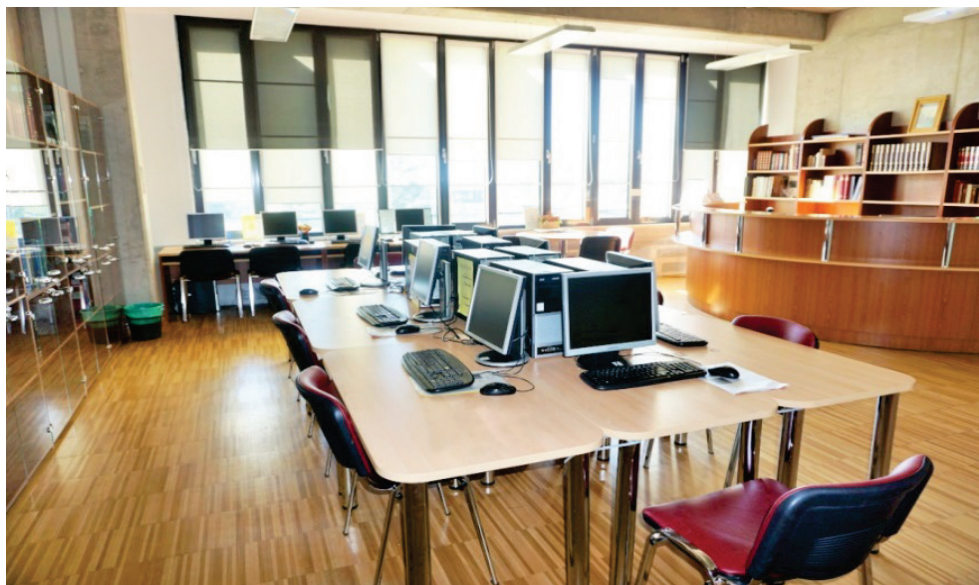
Slika 3. Prostor čitaonice

Edukacijski pristup korisniku primjenjuje se već od samog upisa, pri kojemu korisnik dobiva tiskani Informativni vodič i Edukaciju korisnika na CD-u. Uz to, Knjižnica organizira edukacijske radionice za studente prve godine svih studijskih grupa i ostale zainteresirane korisnike tijekom cijele akademske godine.