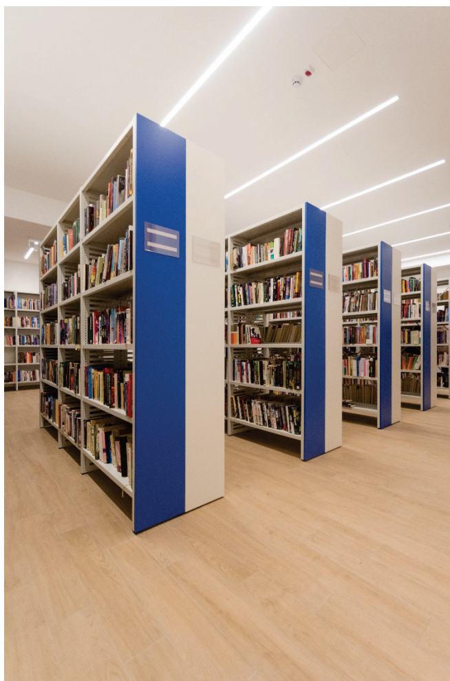
Otvaranje Stare škole

Ima li veće nagrade kada je trud nagrađen najljepšom mogućom nagradom kao što je povijesno preseljenje knjižnice iz skromnih, neadekvatnih uvjeta u prekrasan hram kulture, a korisnici Knjižnice mogu uživati u novom prostoru najznačajnije kulturne institucije Grada Crikvenice.