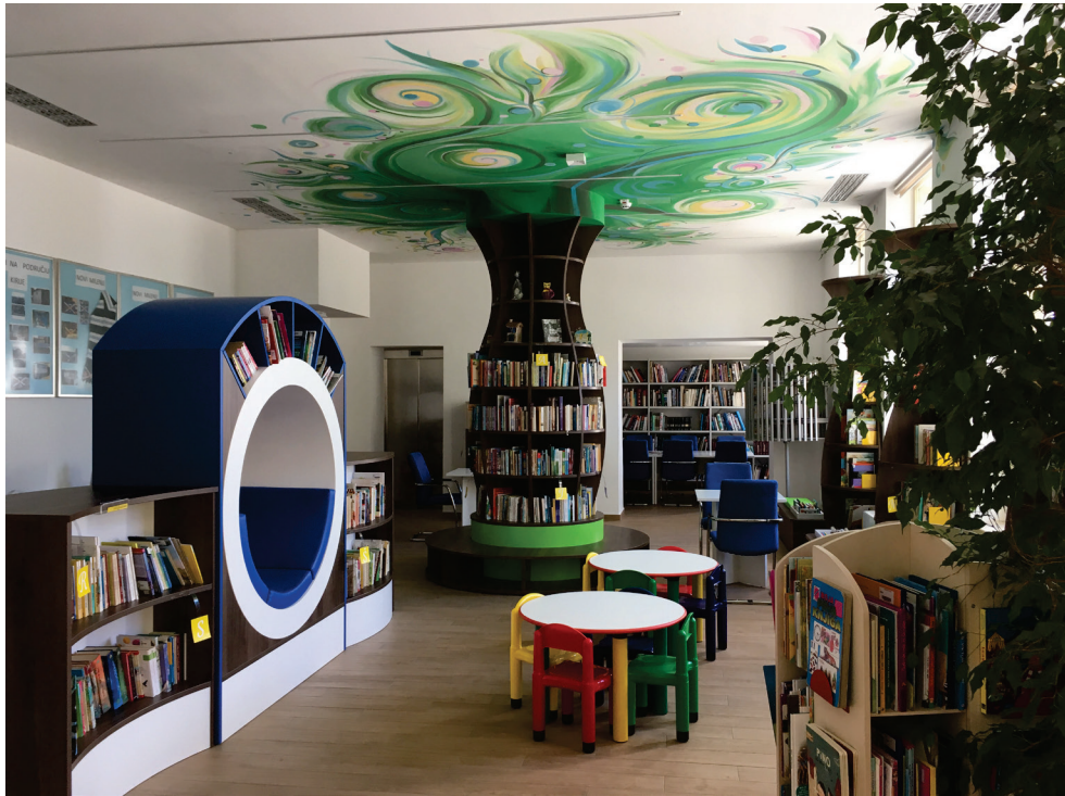
Gradska knjižnica Crikvenica – dječji odjel

Rezultati konkretnog preseljenja Knjižnice u novi prostor su kvaliteta i funkcionalnost novog namještaja i informatičke opreme, maksimalna iskorištenost i dostupnost novog prostora, prilagodba prostora raznim korisničkim skupinama (osobito invalidima, starijim osobama, majkama s djecom i kolicima) te zadovoljstvo korisnika i knjižničnog osoblja gore navedenim, pružanje poboljšanog prostora za upute, istraživanja, izložbe i stručnu obradu zbirke i posebnih materijala. Stoga ulaganja u knjižnice donose dobit i višestruku korist zajednici, na prvi pogled teško mjerljivu, ali dugoročno itekako vidljivu. Uostalom, tiskana je knjiga neupitno najbolji prijatelj kojeg ne mogu ugroziti ni elektronski mediji.