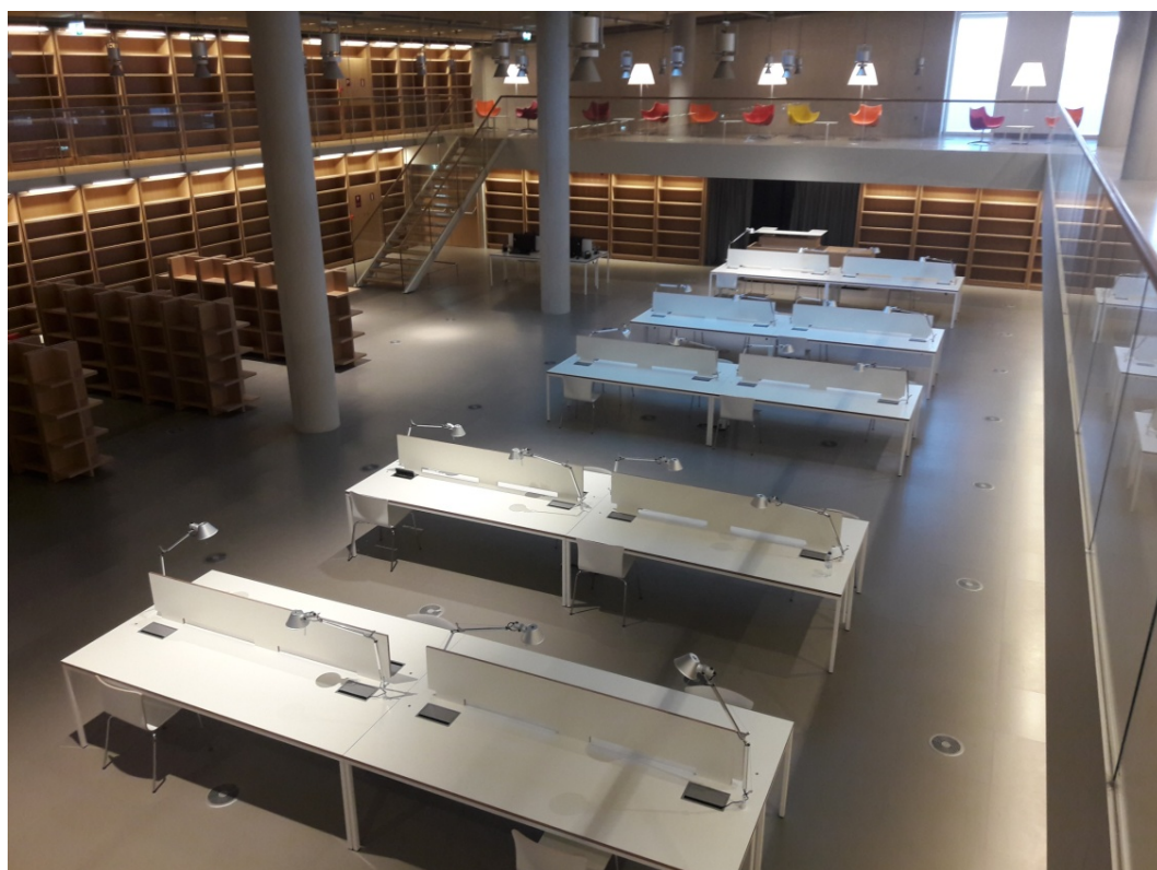
Knjižnica – jedna od studijskih čitaonica

gurnosnih razloga – zbog visine i providne staklene ograde), čime će korisnicima biti uskraćen široki pogled iz visine utvrde ne samo na prostrano predvorje Knjižnice, već i na Agoru i kanal, koji se vide kroz staklenu fasadu. Utvrda knjiga zapravo služi kao vanjska ovojnica studijskih čitaonica koje se nalaze unutar tišeg dijela zgrade. Za istraživački rad namijenjeno je nekoliko čitaonica, u najvećoj istovremeno se može smjestiti čak 150 korisnika. U Knjižnici su opremljeni i prostori za interni stručni rad knjižničara, spremišta s kompaktnim ormarima, laboratorij za digitalizaciju građe, knjigovežnica i sl.