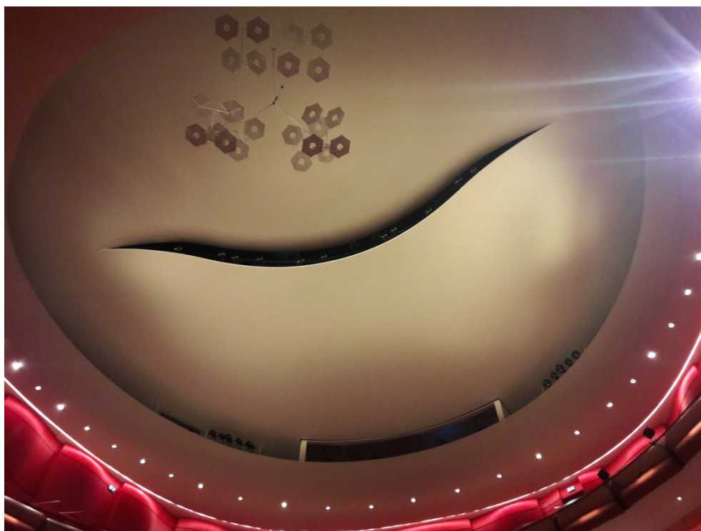
Opera – svod gledališta