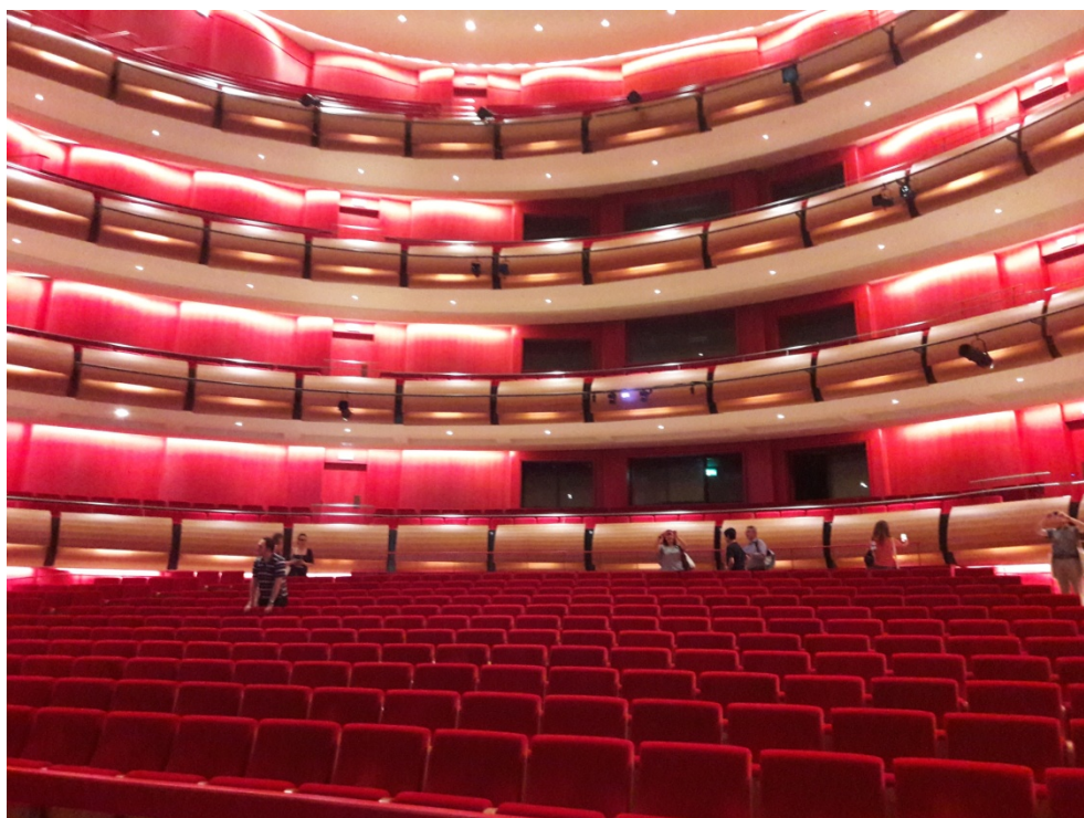
Opera – gledalište

Nova zgrada Nacionalne knjižnice donosi i konceptualnu novost u radu ove ustanove – otvaranje prema javnosti realizirat će se kroz najveću javnu knjižnicu u Grčkoj koja će raditi u sklopu Nacionalne knjižnice. Prostor javne knjižnice smješteni su u prizemlju i na nižim katovima te su u vrijeme našeg posjeta bili opremljeni namještajem, no još je nedostajala građa i ostala oprema. Osobito je zanimljivo što je Knjižnica, još neuseljena, u javnom dijelu bila otvorena i građani je koriste, iako službeno ne radi – koriste mjesta u čitaonicama, prostore za ležerno sjedenje, rade na svojim prijenosnim računalima, čitaju novine itd. Nama knjižničarima bit će zanimljivo pratiti kako će se pomiriti koncepti javne knjižnice i nacionalne knjižnice, tradicionalno zatvorenije prema javnosti, u istom prostoru. U svakom slučaju, novi, reprezentativni i tehnološki suvremeni prostor,