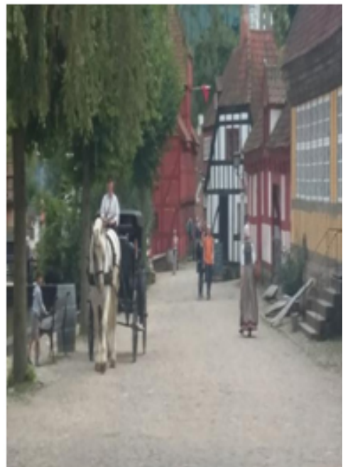
Den gamla by – muzej sa starim povijesnim zgradama od 1700. do sredine 1970. god.