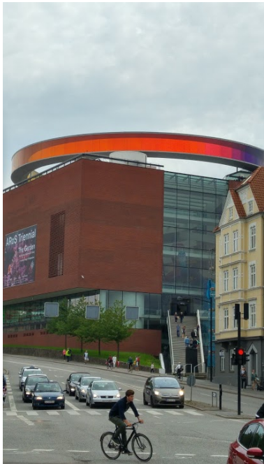
Umjetnički muzej Aros

koji su obučeni u ondašnju odjeću, možete ući u prostorije s tadašnjim interijerom i vidjeti kojim su se zanatima Danci tada bavili.