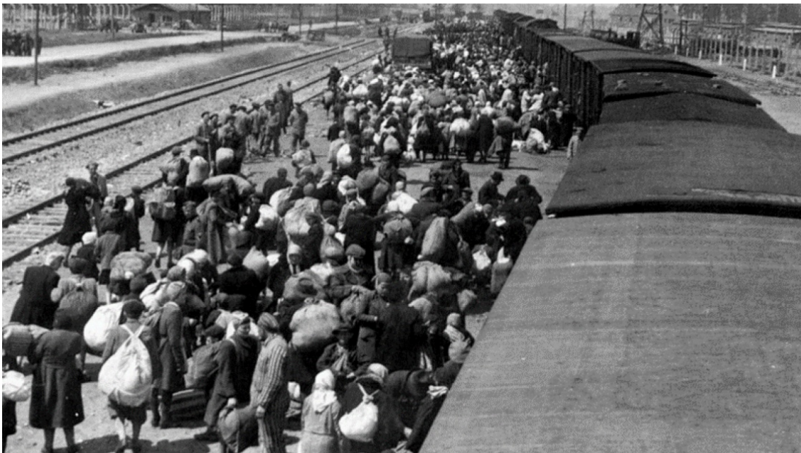
Dolazak Židova u Auschwitz