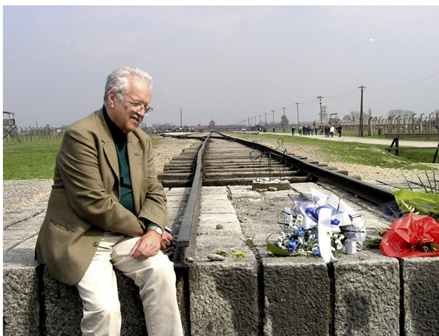
Meditacija na kraju zloglasne željezničke rampe u Auschwitz-Birkenau (2008.)

Sve izneseno, kako na Znanstvenom skupu, tako i u knjizi, značajan je doprinos svih učesnika da upravo na principima izrečenim na početku ovog članka – na razmatranju prošlosti kroje postulate korisne za budućnost.