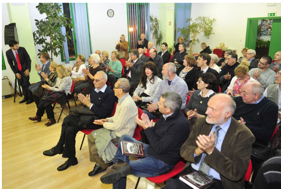
Dvorana Kulturnog doma "Zora" pred početak Presentacije Kronike...