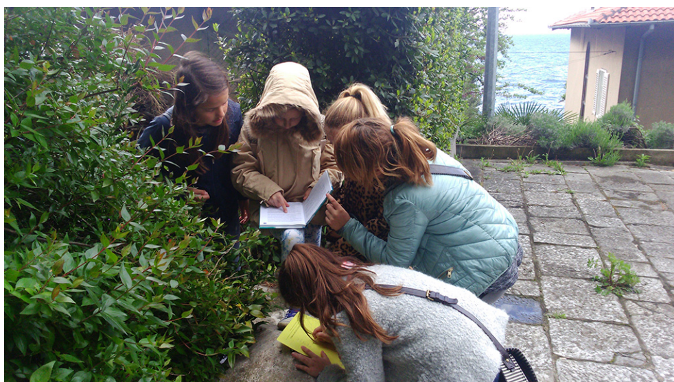
Istraživanje “100 pojmova za 100 godina”