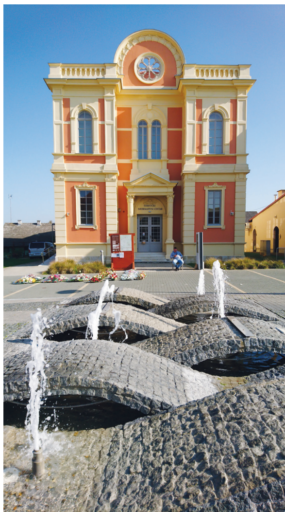
Slika 16: Fontana i obnovljena nekadašnja sinagoga na Strossmayerovom trgu