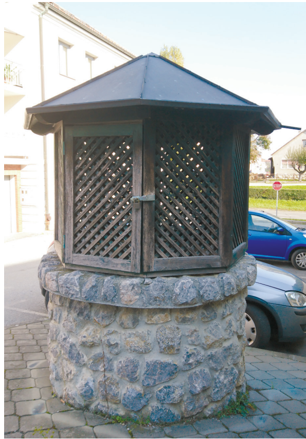
Slika 13: Bunar u Ulici branitelja Hrvatske