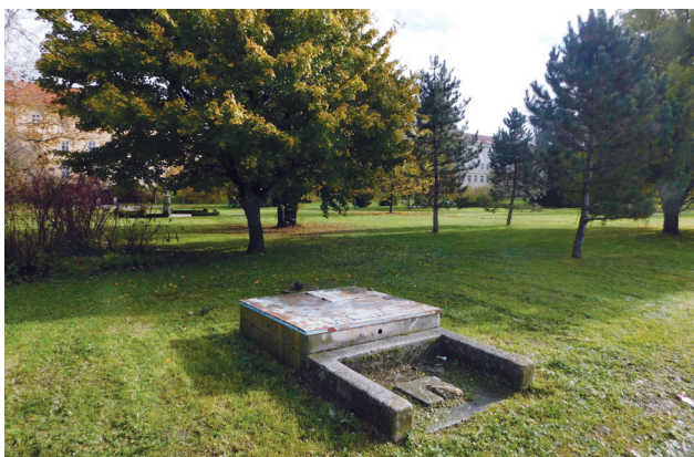
Slika 7: Bunar u parku Gustava Bohutinskog, nekada dvorištu Gospodarskog učilišta