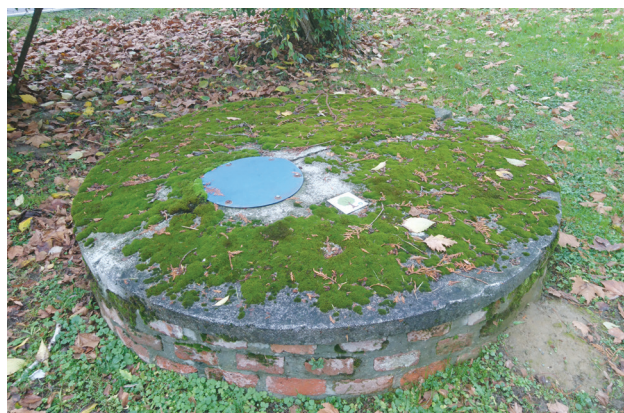
Slika 9: Bunar u Ulici Franje Markovića, nedaleko od lipe gdje je započelo obilježavanje manifestacije Križevačko veliko spravišće