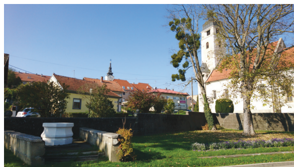
Slika 1: Crkva Sv. Križa i replika krune bunara, uz bunar je vezana predaja o nastanku crkve i imena grada

Crkva Svetoga Križa se u pisanim dokumentima prvi put spominje 1232. godine. Služila je kao župna crkva do 1786. godine, a oko crkve je bilo i najstarije križevačko groblje. U njoj se nalazi jedan od najljepših baroknih oltara kojega je 1756. godine izradio kipar Francesco Robba te slika Otona Ivekovića s prikazom „Krvavog sabora križevačkog“. Izvan funkcije bila je skoro 100 godina. Služila je kao skladište, zatvor i pribježište vojskama, a današnji je izgled dobila 1913. nakon obnove izvedene po nacrtima arhitekta Stjepana Podhorskoga. (Žulj, 2006.)