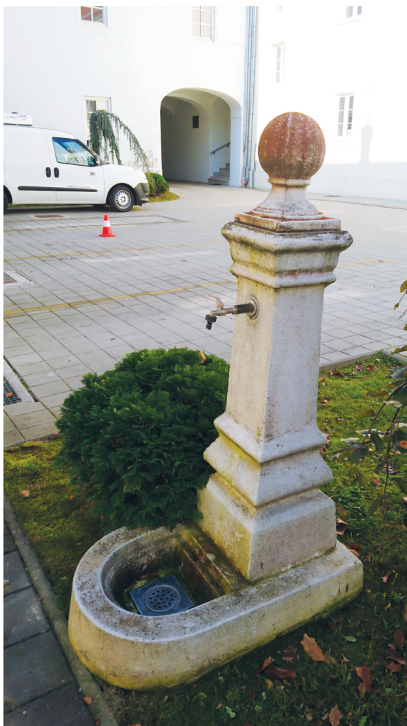
Slika 15: Špina u dvorištu

Projekt U potrazi za križevačkim zdencima – čarobnjakovo čudesno vrelo nije samo priča o križevačkim bunarima koji život znače i koje su Križevčani oteli zaboravu, nego puno više od toga.