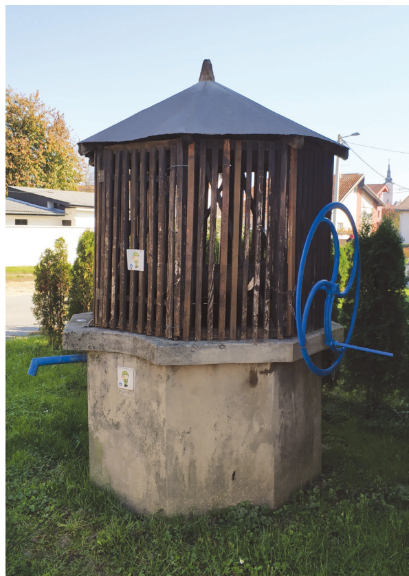
Slika 14: Na putu prema željezničkom kolodvoru, bunar uz zgradu Hrvatskog zavoda za zapošljavanje