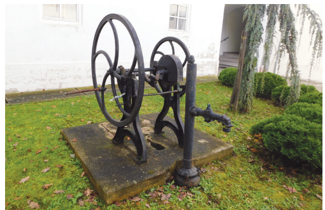
Slika 5: Mali dragulj u Zakmardijevoj ulici