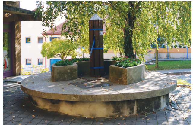
Slika 4: Bunar u Ulici Matije Gupca