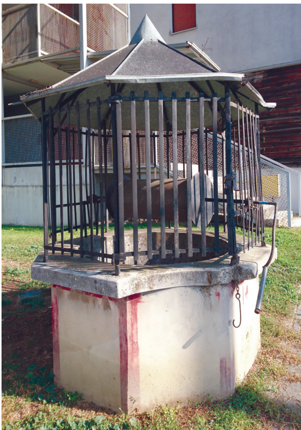
Slika 12: Bunar u Ulici Alberta Štrige