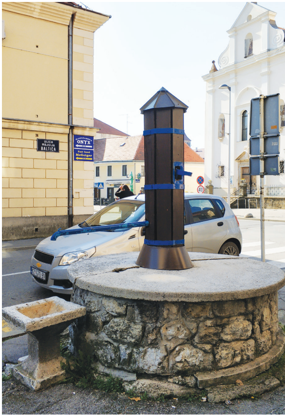
Slika 11: Bunar u Ulici Mojsija Baltića