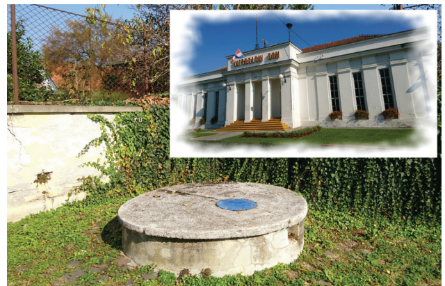
Slika 6: Bunar kod Vatrogasnog doma