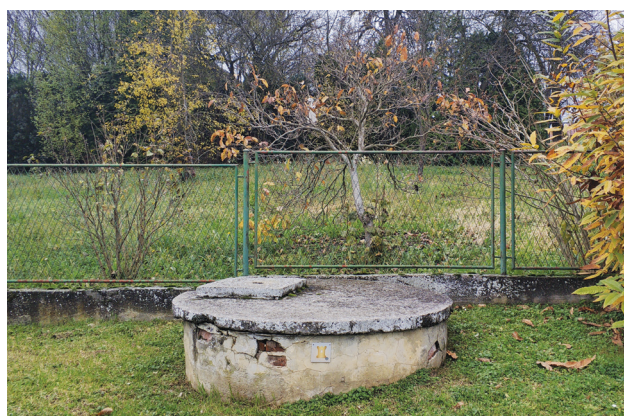
Slika 10: Bunar u Kalničkoj ulici

pavlina Ivana Rangera. Svetac u lijevoj ruci drži zastavu, a u desnoj vedricu s vodom i polijeva požarom zahvaćene kuće.