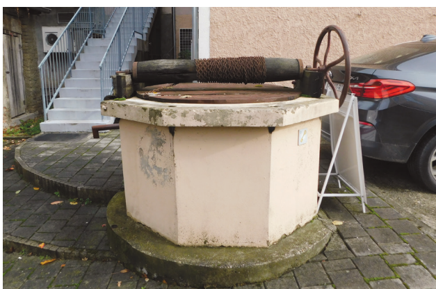
Slika 8: Bunar u dvorištu nekadašnjeg Grand hotela