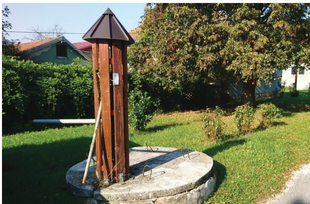
Slika 3: Bunar u Ulici Frana Gundruma