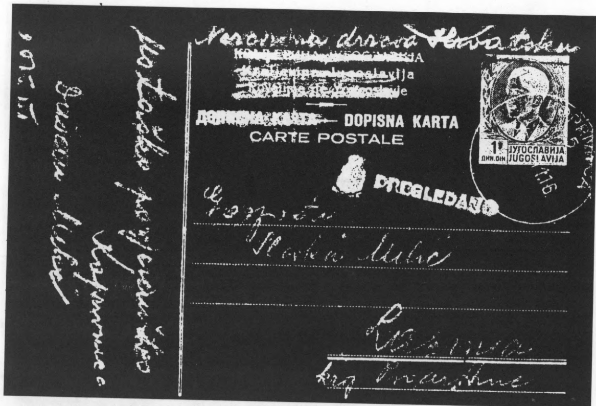
4), 5), 6), 7) Dopisne karte pisane iz logora