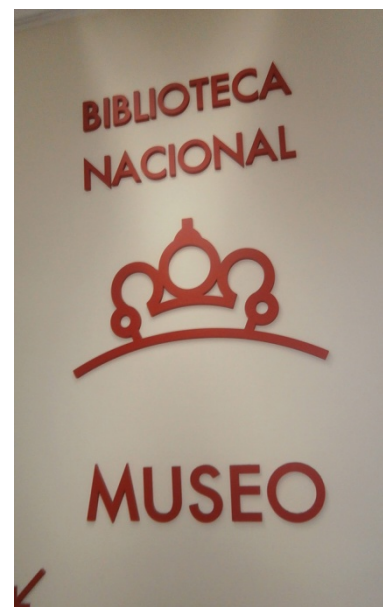
Figure Cervantesovih karaktera prezentiraju magično literarno mjesto, s igrom ogledala, labirintom karti, a ima i malu pozornicu te kostime u koje se možete preodjenuti i odglumiti neku scenu iz njegovih djela.

deran jer kao da ulazite u svijet njegovih djela i susrećete likove njegovih romana u godinama oko 1600.-te.