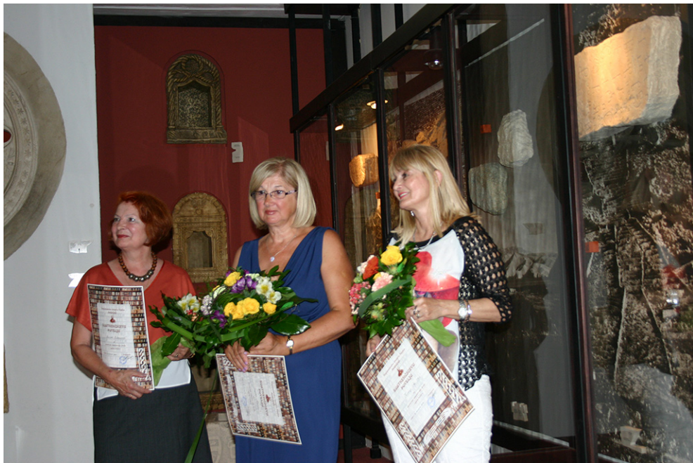
Dobitnice Povelje "Kostrenčić" 2016. godine