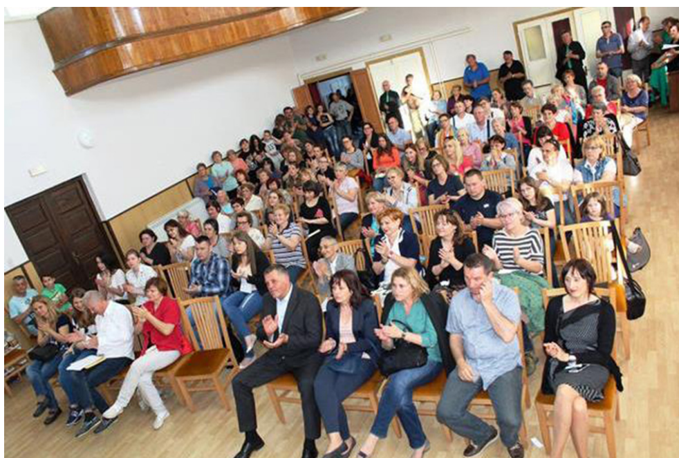
Dom kulture u Lukovdolu

U suorganizaciji s Gradskom knjižnicom Ivan Goran Kovačić Vrbovsko, trideset i osam naših članova i suradnika 4. lipnja 2016. godine prisustvovalo završnoj manifestaciji Goranova proljeća u Lukovdolu. Goranovo proljeće, pjesnička je manifestacija koja počinje prvog dana proljeća na rođendan Ivana Gorana Kovačića (1913.). Tada se dodjeljuje Goranov vijenac za pjesnička postignuća i Goran za mlade pjesnike ( www.igk.hr ).