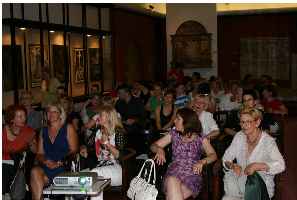
Izborna skupština KDR-a