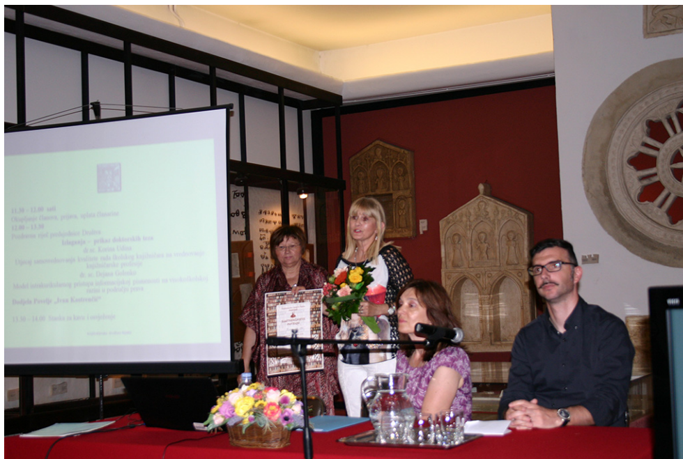
Komisija za dodjelu Povelje "Ivan Kostrenčić"