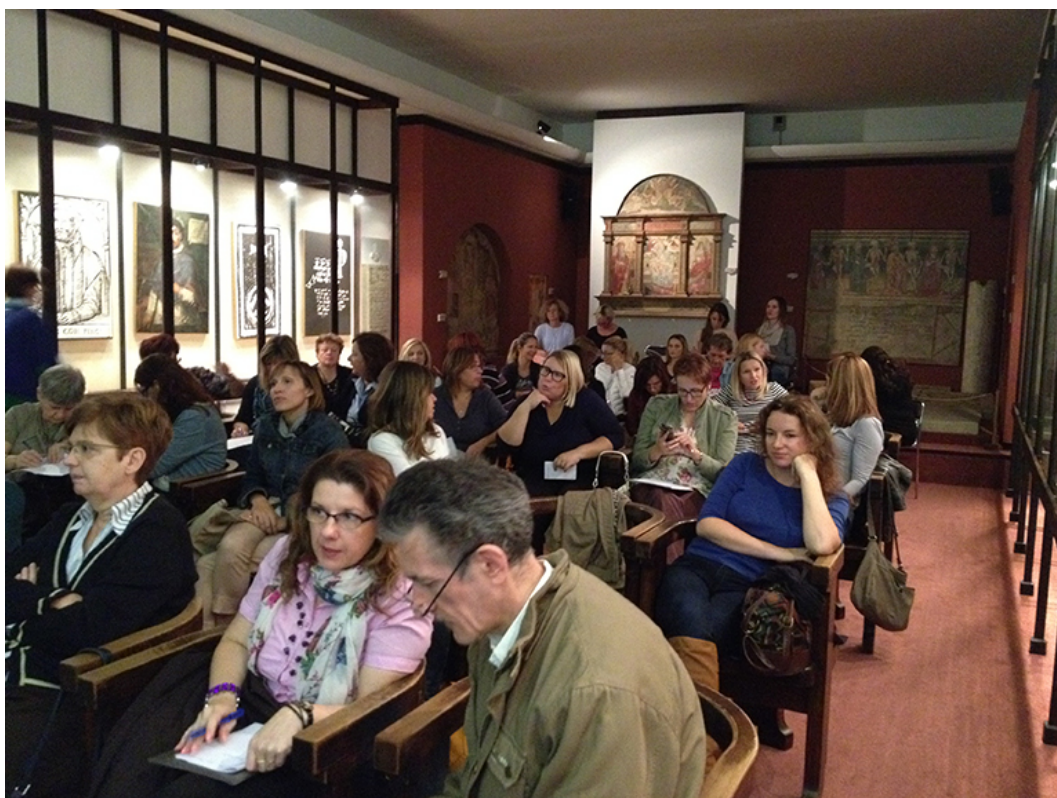
Delegati na skupštini KDR-a