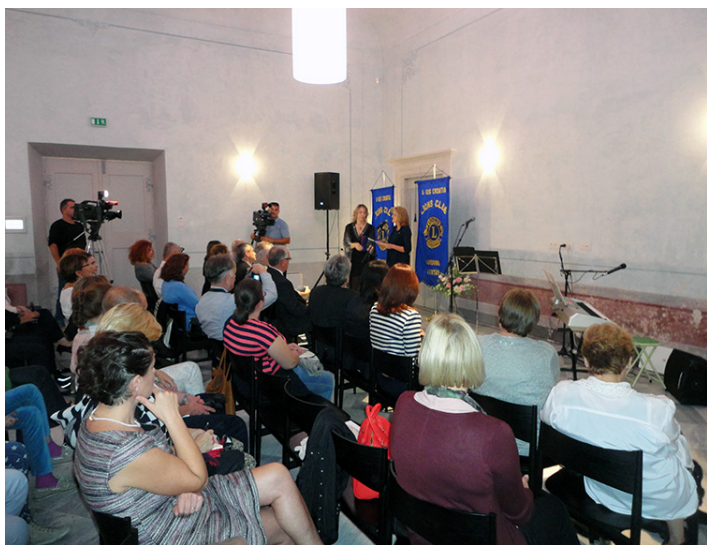
Promocija taktilne slikovnice 2014. u ljetnikovcu Kaboga