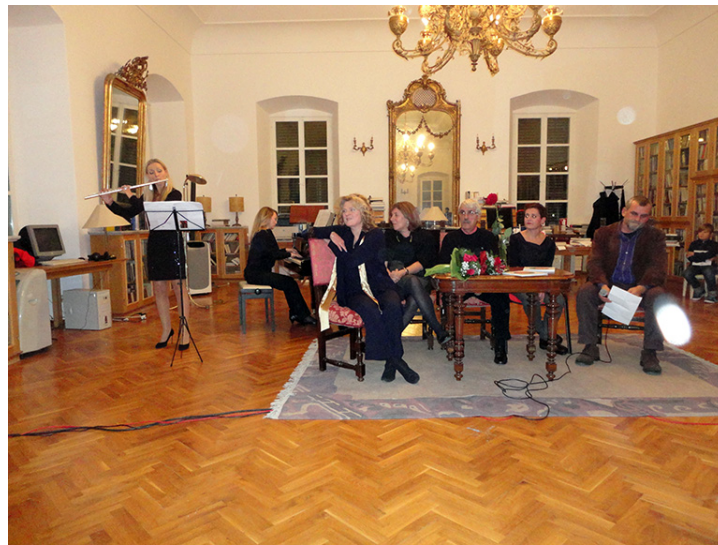
Promocija 2013. u Salonu od zrcala, Narodna knjižnica Grad

lih. Nakon predstavljanja dječje knjižice tiskane 2013. godine u izdanju Društva dubrovačkih pisaca, javile su se kolegice, učiteljice, koje su priču odmah nakon promocije čitale i obrađivale s učenicima u svojoj školi. Promocija knjige u Narod-