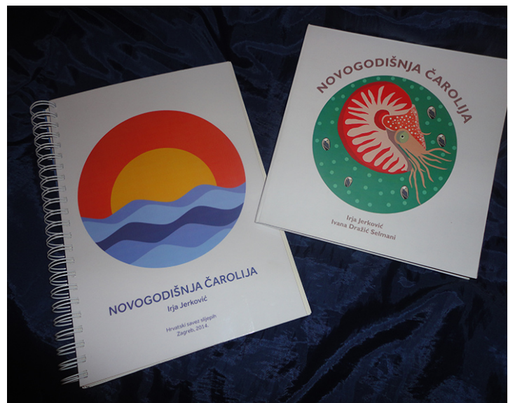
Taktilna i originalna Novogodišnja čarolija