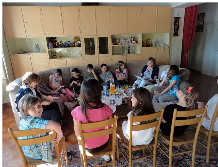
Zajedničko čitanje u domu "Maslina"

Rad s ljudima iz Saveza na ovoj knjizi izuzetno me intelektualno i duhovno obogatio i nadam se da će naša suradnja stvoriti još puno dobre čarolije života.