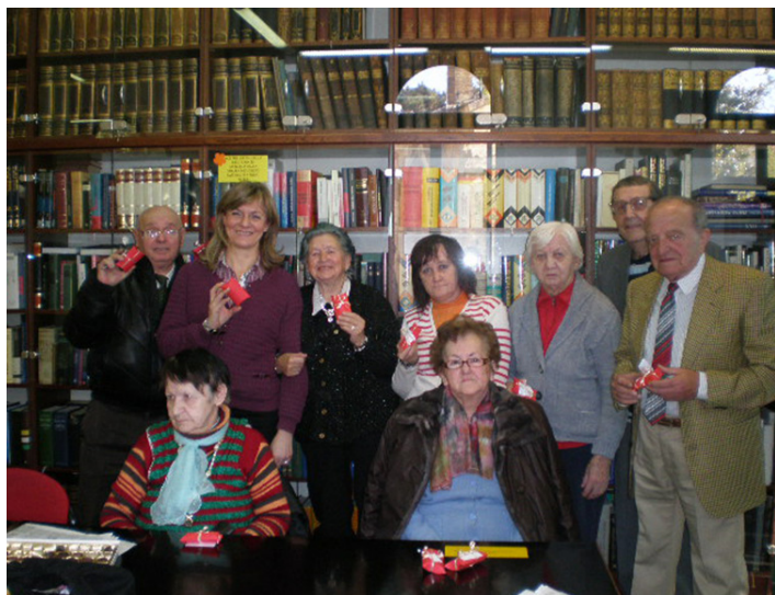
Umirovljenici doma Volosko – Valentinovo u knjižnici