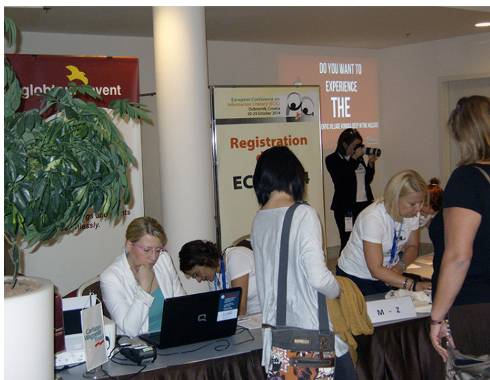
ECIL 2014. – Registracija

University of Washington) koji je dekan emeritus i čiji znanstveni interes je usmjeren prema području informacijske pismenosti, informacijske tehnologije, upravljanja informacijama u procesu učenja i poučavanja, te obrazovanju knjižničara. Poznat je po svojem inovativnom pristupu nazva-