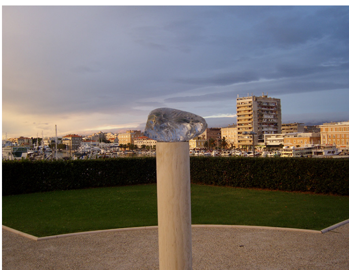
Muzej antičkog stakla, Zadar

Školski knjižničari stručno su se usavršavali od 24. i 25. listopada 2014. u Muzeju antičkog stakla u Zadaru. Skup je održan pod pokroviteljstvom Ministarstva