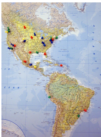
Predavači iz Sjeverne i Južne Amerike