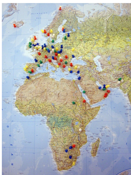
Svaki sudionik ECIL-a 2014. je označio grad iz kojeg dolazi