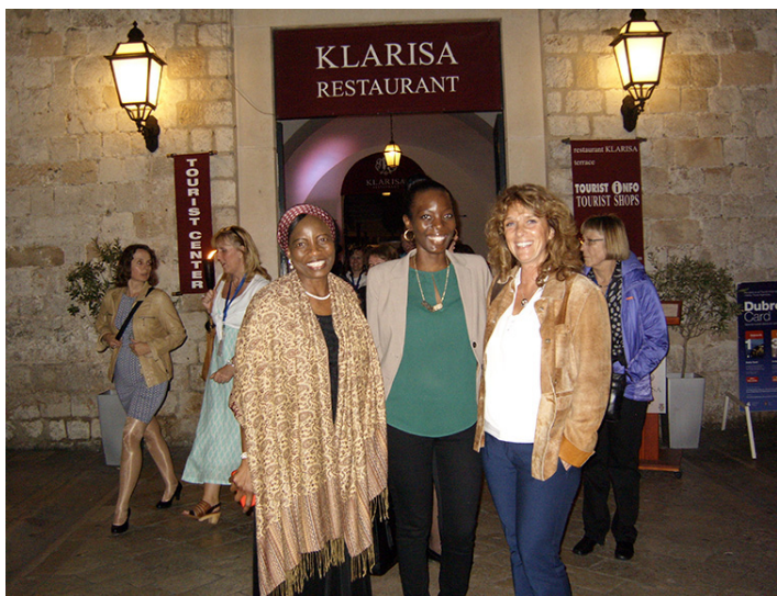
Knjižničarke iz Tanzanije

inog Odbora za informacijsku pismenost. Pozvani je predavač na međunarodnim konferencijama o informacijskoj pismenosti te je autor više od 100 publikacija. Od 2005. godine vodi Blog o temama informacijske pismenosti ( Information Literacy Weblog ; http://information-literacy.blogspot.com ).