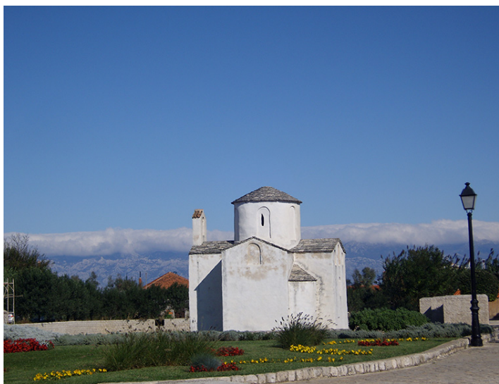
Najmanja i najstarija katedrala u Ninu

Drugog dana knjižničari su posjetili stalnu izložbu crkvene umjetnosti (poznatu pod nazivom “Zlato i srebro Zadra”, crkva sv. Marije). Nakon izložbe bili smo pozvani u školsku knjižnicu Klasične gimnazije Ivana Pavla II. s pravom javnosti. Stručni izlet kojim se odazvalo tridesetak sudionika uključio je obilazak Nina, Muzeja ninskih starina, Arheološkoga muzeja Nin i arheoloških lokaliteta na području grada.