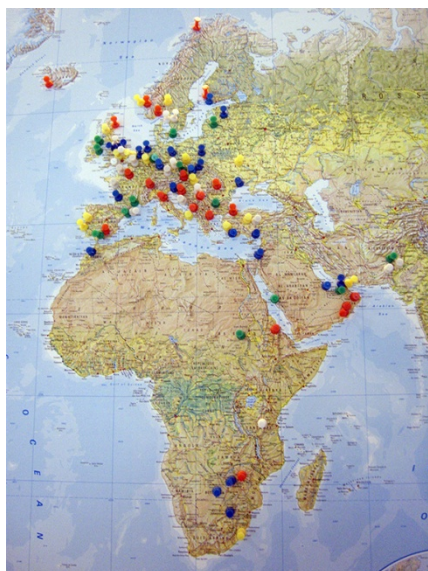
Svaki sudionik ECIL-a 2014. je označio grad iz kojeg dolazi