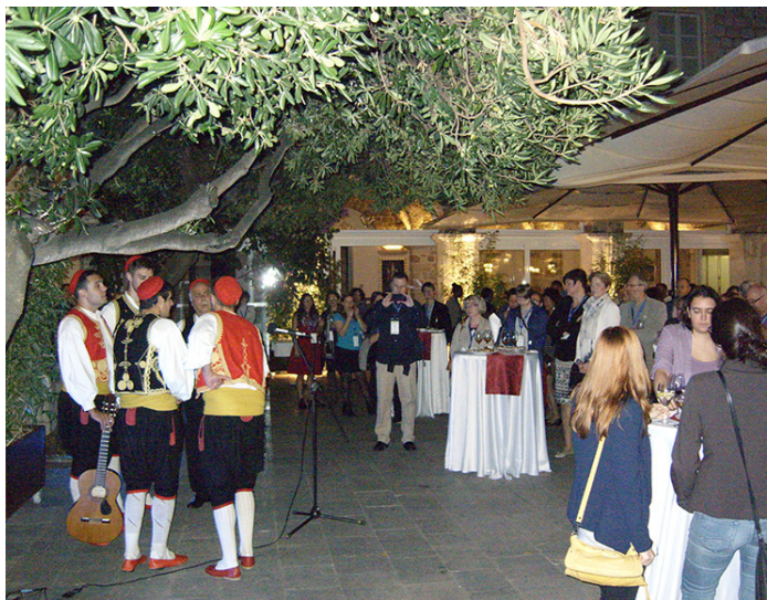
Welcome drink u samostanu Klarisa, Dubrovnik. Svečani prijem u Gradu