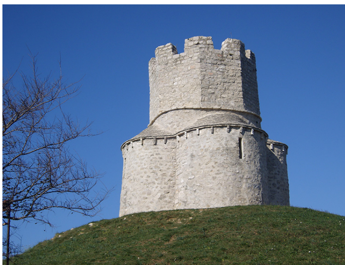
Crkvica Sv. Nikole – mjesto počasti svih hrvatskih kraljeva nakon krunidbe – Nin. Sv. Nikola pod zaštitom je UNESCO-a