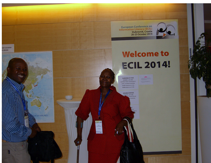
Welcome to ECIL