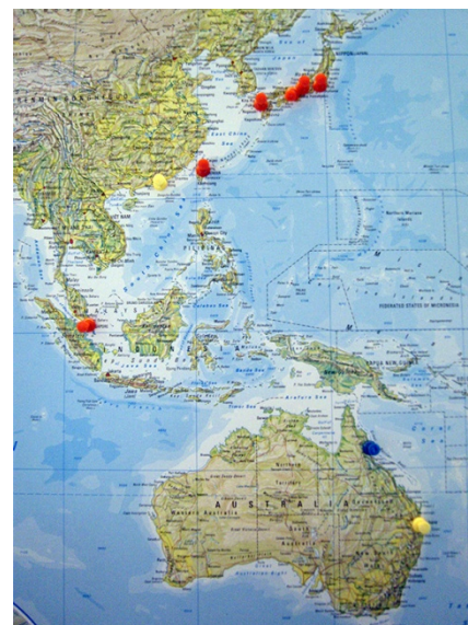
Azija i Australija