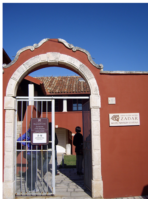
Muzej ninskih starina