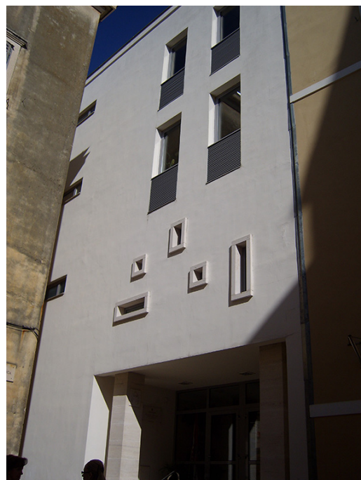
Klasična gimnazija Ivana Pavla II u Zadru

Naziv skupa Sine qua non školskoga knjižničarstva odabran je stoga što je cilj skupa utvrditi što je temelj rada školskoga knjižničara koji osigu-