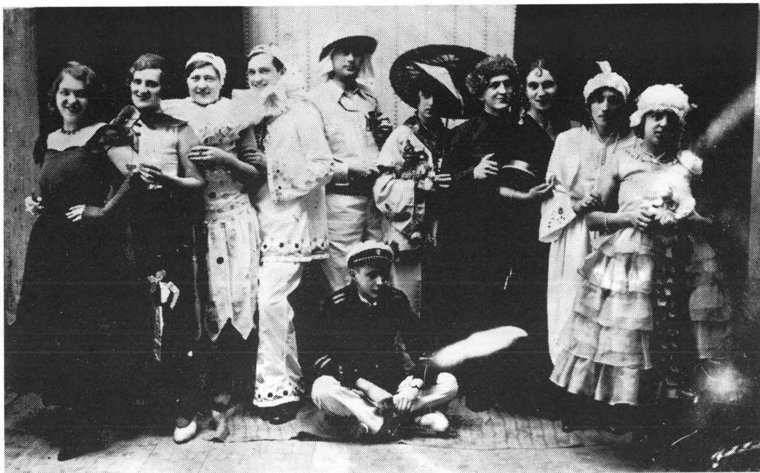
Grupa maskiranih na pokladnoj zabavi 1932.