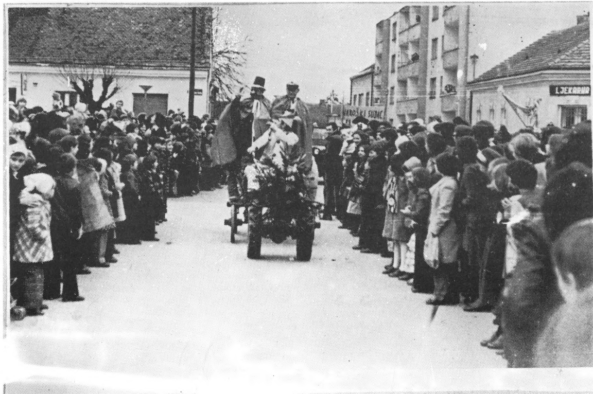
Fašnik u Ludbregu 1977.

I tako bi se redom iznosili »zločini« optuženog, dok konačno ne bi pala osuda: