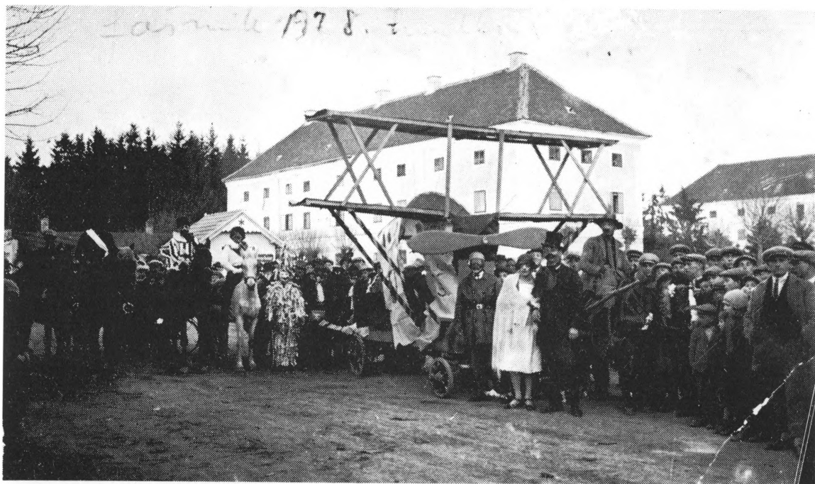
»Ludbreški avion« ispred zgrade kotarskog suda (vlasništvo firme Berger; nekad knezova Batthyany) 1928. lijevo u pozadini vidi se krov kotarskog zatvora

ostati nezapažen, neobjavljen. Među ostalim vijestima na primjer o tome koji naš građanin dok je »dobre vole sekirom briše obloke«, kojega su na vatrogasnoj zabavi vunbaciteli našli pod stolom i odnesli na friški zrak itd., itd., objavljena je i pjesma o našim pomodarkama.