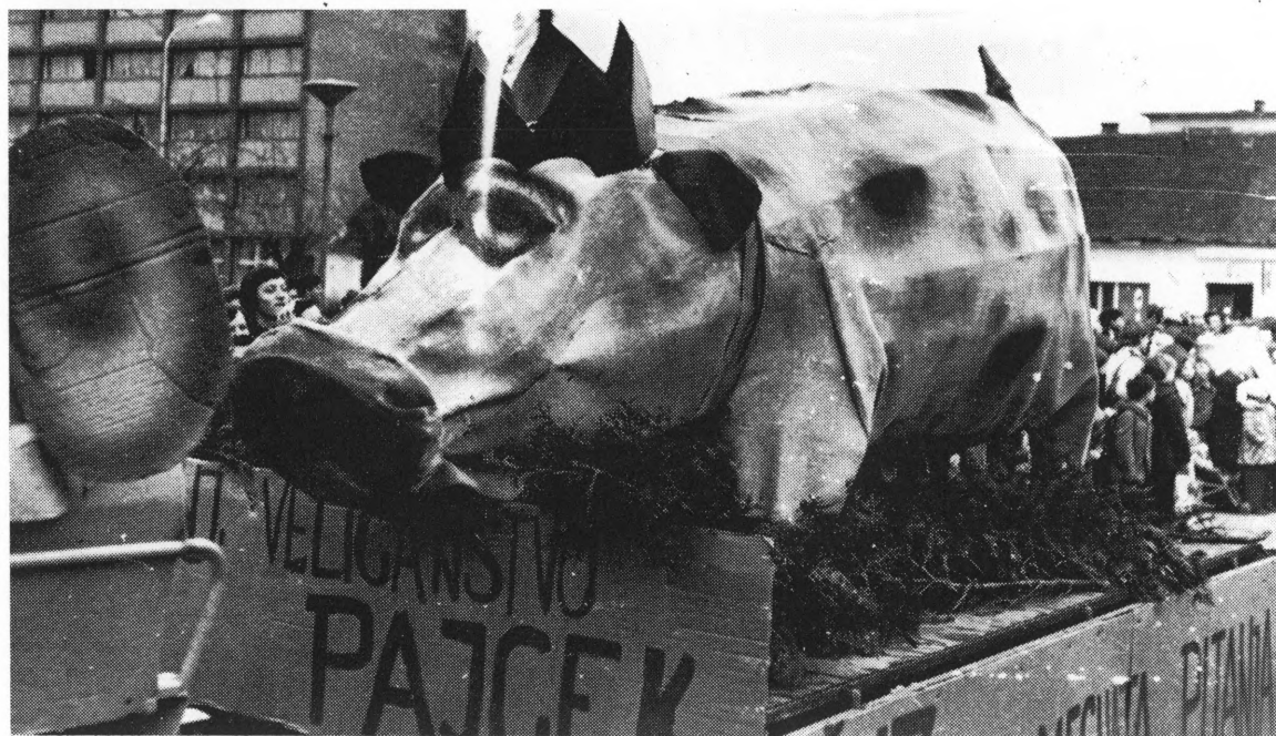
Njegovo Veličanstvo Pajcek i riješena mesnata pitanja 1977.

Dva ludbreška mesara prezimenom: Pap i Koder »Klopotec« je udružio u firmu »Papkoder«. Među ostalim o njima je pisano i ovo: »Vesele se što je mesu cena pošla jemput dol, natječu se koj će dati v kilu mesa kosti pol.«