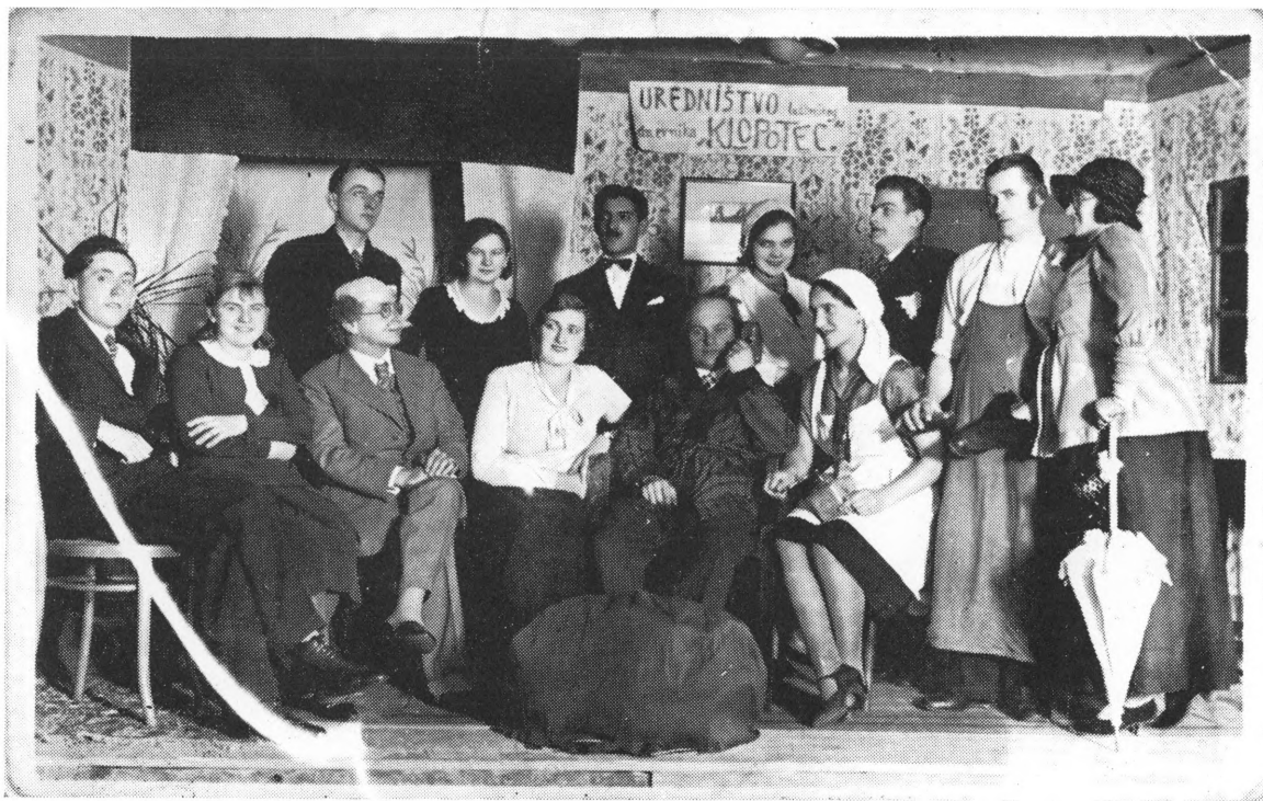
Uredništvo Klopoca na novogodišnjoj zabavi 1931.

Uz Mirkeca bilo je u našem mjestu još nekoliko građana koji su uživali opće simpatije i poštovanje, ali je