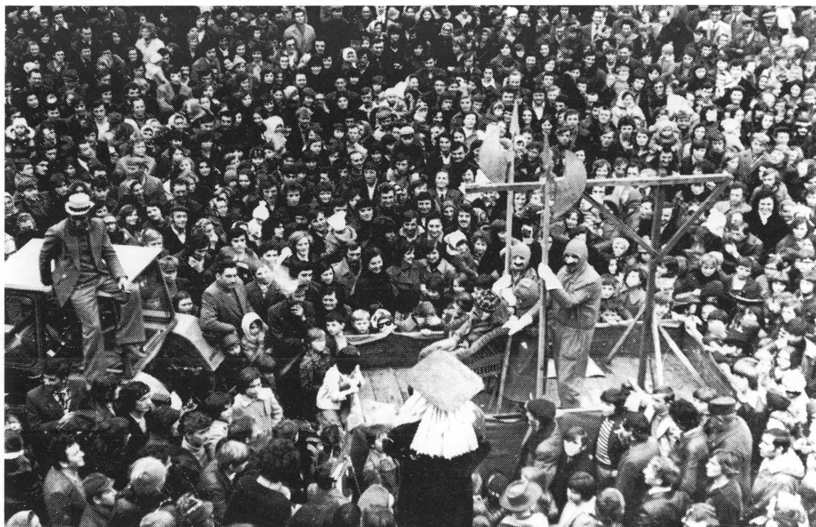
Fašnik pod vješalima. Sudac (sprijeda u sredini) čita pred narodom osudu (1977)

»Fašnjak!!! Ti si tat, prevarant, coprnjak, i smrdilavec. Ti si tepec, pijanec i zapelivec. Ti si preveć zla napravil, ali ve nas buš ostavil. V ime našeg slavnog roda, nek te ve odnese voda!«