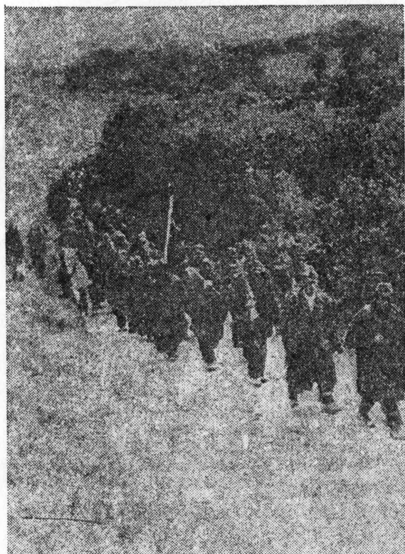
Kalnički partizanski odred na maršu iz Bilogore na Kalnik