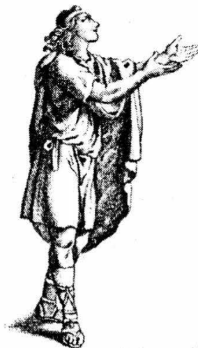
Slika br. 36 u navedenoj knjizi J. Engelsa (br. 12 sa popisa)

5. Do sada (studenj 2008.) pronađeno je i izlučeno 16 naslova knjiga dr. Jurja Dobrile. Tek nakon što se ponovno formira cjelokupna zbirka moći će se ustanoviti stvaran broj njegovih knjiga. Tada će se moći sa većom mjerom točnosti zamijetiti i moguće neoznačene knjige kao Dobriline ili nekog drugog, za sada, nepoznatog vlasnika.