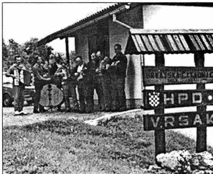
Kočki tamburaši ispred Čitaonice

Život je u Gornjim Kutima i danas težak. Premalo se čini da se smanji iseljavanje iz goranskih naselja, a još manje da se pomogne onima koji su u poluopustjelim selima dočekali starost. Ne bude li se na državnoj razini poduzelo učinkovite korake za oživljavanje Gorskoga kotara, neće ni Gornji Kuti ni Čitaonica imati budućnost, a to bi bila nemjerljiva šteta i za Kočane i za širu zajednicu.