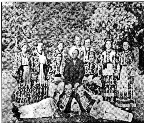
Dramska družina Čitaonice, 1937.

Mještani Gornjih Kuti osnovali su svoju Čitaonicu krajem 1936. godine, u vrlo nepovoljnim uvjetima. Bilo je to međuratno vrijeme, doba Kraljevine Jugoslavije čije su vlasti ograničavale građanske slobode, pa i sva okupljanja, a osobito ona koja su mogla izazvati "političke probleme". Bilo je to i vrijeme svjetske ekonomske krize, čije su pogubne posljedice – nezaposlenost i glad – ispraznile goranska sela. Dogodilo se, međutim, nešto posve neočekivano – mještani su izlaz iz svojih teškoća potražili i našli u osnivanju čitaonice s posudbenom knjižnicom. Oni su već tada znali, i čvrsto na tome do danas ustrajali, da je knjižnica golem dobitak za zajednicu u kojoj djeluje. Ovako napredan stav ni do danas nisu usvojile brojne društvene zajednice pa u svijetu, a i kod nas, još ima mnogo krajeva u kojima se knjižnica doživljava i tretira kao luksuz.