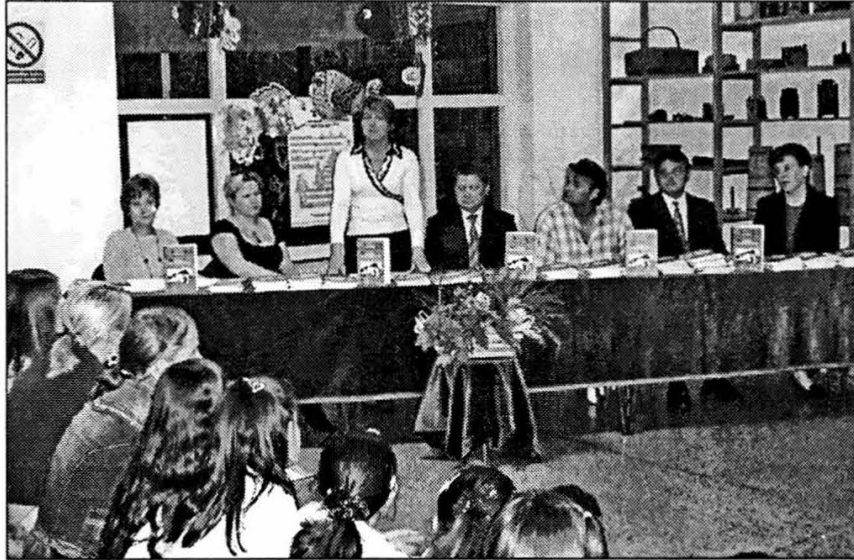
Proslava 70. obljetnice Čitaonice u OŠ B. Moravice

Iako priča o povijesti Čitaonice mnogima izgleda bajkovito, iza nje stoje desetljeća rada čitavog sela i šire okolice, desetljeća odricanja i trpljenja, ali i desetljeća ljubavi prema knjizi i pisanoj riječi kao neiscrpnom izvoru zabave, kulture i prosperiteta. Danas mještani Kuti i ostali članovi Čitaonice s pravom očekuju pomoć u opremanju i održavanju svoje ustanove.