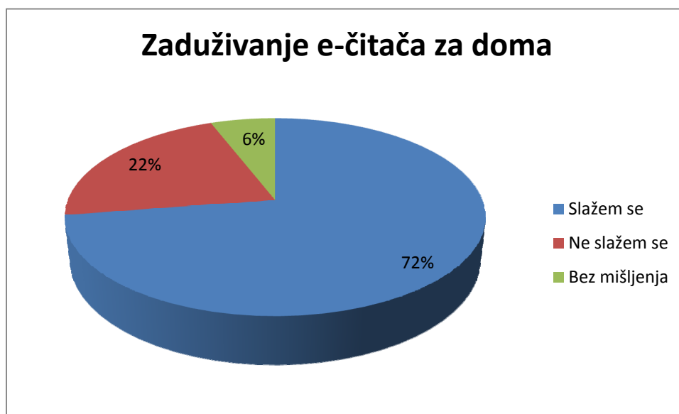
Grafikon 3: Zaduživanje e-čitača za doma

Neki anketirani zaposlenici napisali su i obrazloženje za slaganje, tj. neslaganje sa zaduživanjem e-čitača u narodnoj knjižnici posudbu izvan knjižnice. Kod slaganja su navedena sljedeća obrazloženja: zaduživat ćemo ako hoćemo želimo pratiti trend; čitač je obogaćivanje knjižnične ponude i novi put za poticanje čitanja; mora biti dio knjižnične zbirke jer živimo u takvom vremenu; zaduživanje je nužno jer je to sad modni hit iako predviđam da će troškovi kvarova i oštećenja biti preveliki; dok čitači neće biti prihvatljivi cijenom i dok će knjižnice zaduživati e-knjige, knjiž-