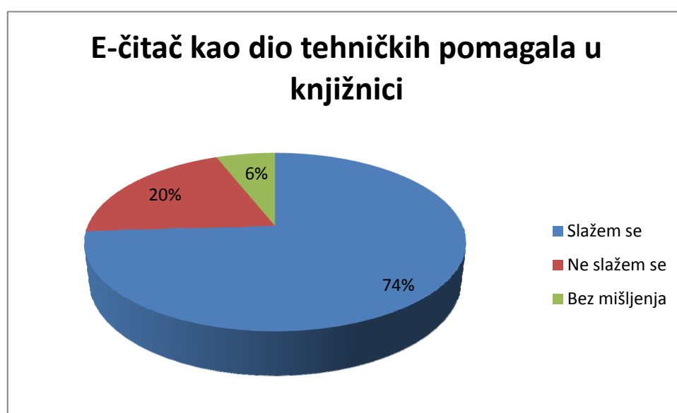
Grafikon 2: E-čitač kao dio tehničkih pomagala u knjižnici

37 (74%) anketiranih se slaže sa zaduživanjem e-čitača u narodnoj knjižnici izvan knjižnice (tablica 3, Grafikon 3), među kojima 32 (64%) misli da bi e-čitač morao biti dio tehničkih pomagala u narodnoj knjižnici. Sa zaduživanjem e-čitača izvan knjižnice ne slaže se 11 (22%) anketiranih, a 2 (4%) anketiranih nije odgovorilo.