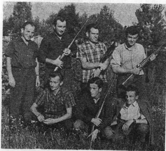
Strijelci iz Koprivnice na prvenstvu Hrvatske u Zagrebu 12. kolovoza 1962. godine