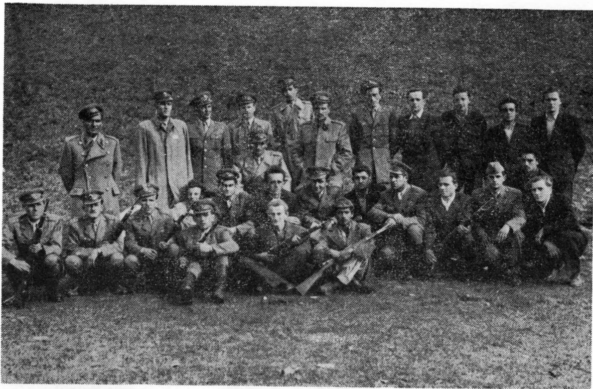
Susret strijelaca koprivničkog garnizona JNA i ekipe »Branko Badalin« u Reki 1951. godine

nova. Jedan od glavnih zadataka bio je da se aktivira nekoliko streljačkih družina koje su prestajale biti aktivne, a to se posebno odnosilo na đurđevačko područje. Na jednoj od sjednica KSO donijeta je odluka da se priđe osnivanju pionirskih ekipa, a o tome je u jednom dopisu 1955. godine obaviješten i Streljački savez Hrvatske od kojeg se tražilo da za rad pionirskih ekipa osigura dovoljan broj zračnih pušaka, kojih je bilo vrlo malo u streljačkim družinama (bilo je družina koje nisu imale ni jednu zračnu pušku). Kotarski streljački odbor također je streljačkim družinama redovito raspoređivao puške i kontrolirao održavanje naoružanja, jer bilo je slučajeva da neke streljačke družine nisu posvećivale dovoljno pažnje održavanju oružja s kojim su bile zadužene. Naravno, članovi tih družina i njihova rukovodstva bila su pozivana na odgovornost, a nekima su bile izrečene novčane kazne.