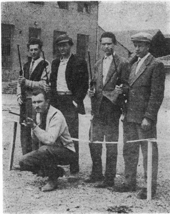
Strijelci »Mladosti« iz Koprivničkih Bregi, 1959. godine