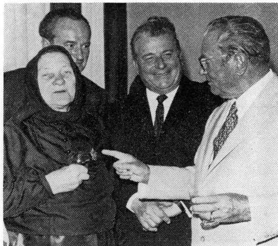
Drug Tito u srdačnom razgovoru u hotelu »Podravka« u Koprivnici 1971. godine

List »Podravka«: »Bio je to trenutak kojeg smo dugo priželjkivali. Petak, 10. rujna 1971. godine, ostatak će zapisan zlatnim slovima u povijesti našeg kolektiva. Danima smo se spremali da u svoju radnu sredinu primimo našeg druga Tita, da mu pokažemo ono što smo uradili u poslijeratnim godinama vlastitim odricanjem, bez tuđe pomoći, da mu ukažemo na naše probleme koji nas tište, da mu ukažemo na jedinstvenost radničke klase, da mu pokažemo na koji način slijedimo put što nam ga je ucrtao upravo on — prvi čovjek naše ratne i poslijeratne revolucije, revolucije u kojoj se zajedno s njim borimo da radnička klasa postane zaista temelj našeg društva i da zajedno s rad-