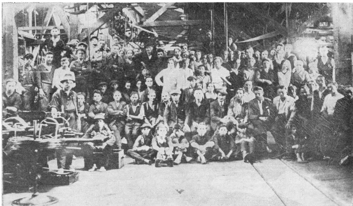
Grupa ranika Prve jugoslavenske tvornice pletene žice »Danica d.d.« u Koprivnici, kojima je 1928. godine dolazio drug Josip Broz Tito