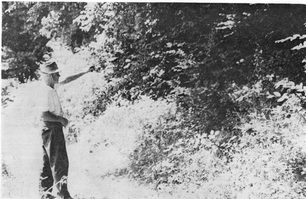
Jedno od mjesta gdje su bili bunkereri kod Ribnjaka

U početku je to radila ista petorka pod stručnim vodstvom Dušana Rašića. A i sam Miloš je nešto znao o bunkerima, onoliko koliko je spoznao u Slavoniji boraveći po bolnicama. No, vidjelo se da sami neće moći sve obaviti.