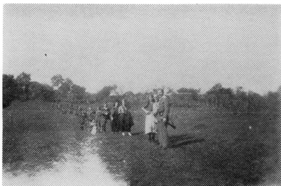
Kazališna družina Okružnog NOO Bjelovar pozlaži 1943. na miting u Prugovac

Trčeći smo stigli do zgrade i lupanjem dovali blagajnika, koji je s obitelji stanovao na prvom katu. Sav prestrašen, u gaćama, blagajnik je otvorio i od straha nije znao govoriti. Objasnio sam mu da je sve opkoljeno, da mu se neće ništa dogoditi ako preda oružje, novac i sve što nam treba. Kad se malo pribrao, rekao je da oružje nema, a drugo neka uzmemo. Najteže je bilo s ključevima od blagajne. Od straha nije ih mogao naći. Svugdje ih je tražio, međutim našla mu ih je žena u stanu. Velika čelična blagajna bila je puna kovertiranog novca. Sutra