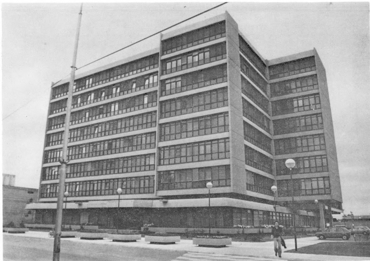
Nova poslovna zgrada »Podravke«, useljena 1979. godine, jedna od najsuvremenijih u prirodi naše republike

dućeg kooperanta u razvijenoj industrijskoj sredini, trebamo realno ocijeniti mjesto tom budućem ravnopravnom zanimanju u našem društvu, a ne prilaziti tom problemu kao nasljednom.