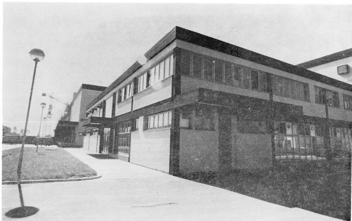
Nova klaonica »Podravke« u Koprivnici, važan faktor razvoja podravskog stočarstva