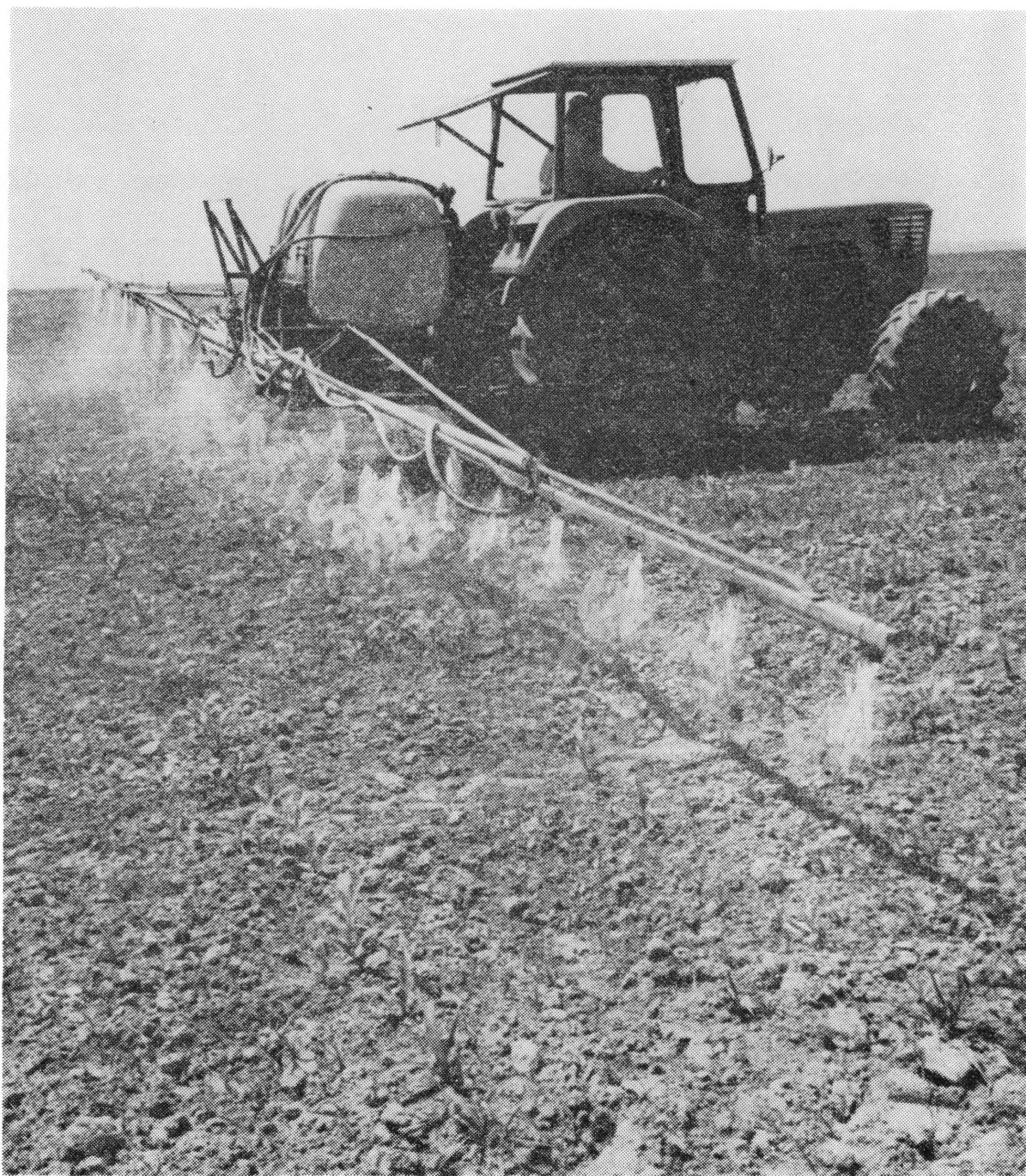
Prihrana kukuruza na »Podravkinim« oranica- ma kod Đelekovca