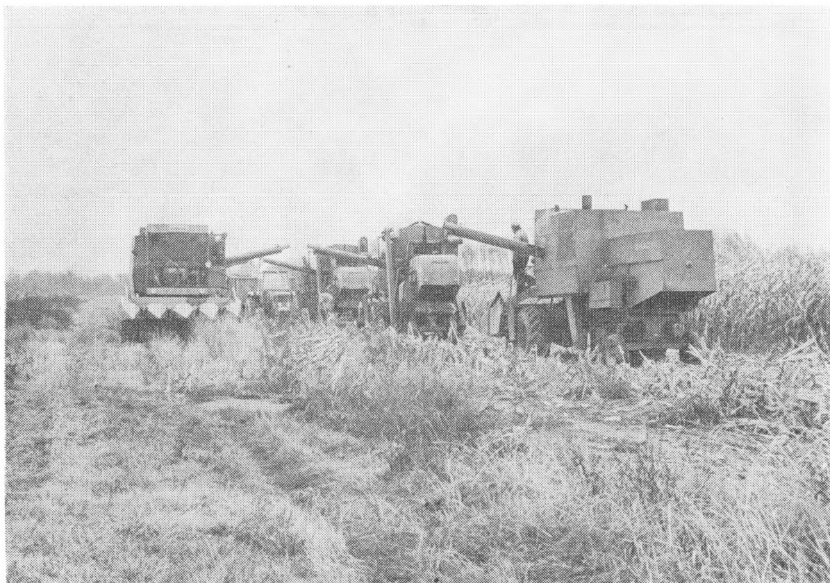
Berba kukuruza na »Podravkinim« poljima 1979. godine. Poljoprivreda zavređuje u idućem srednjeročnom planskom razdoblju osobitu pažnju