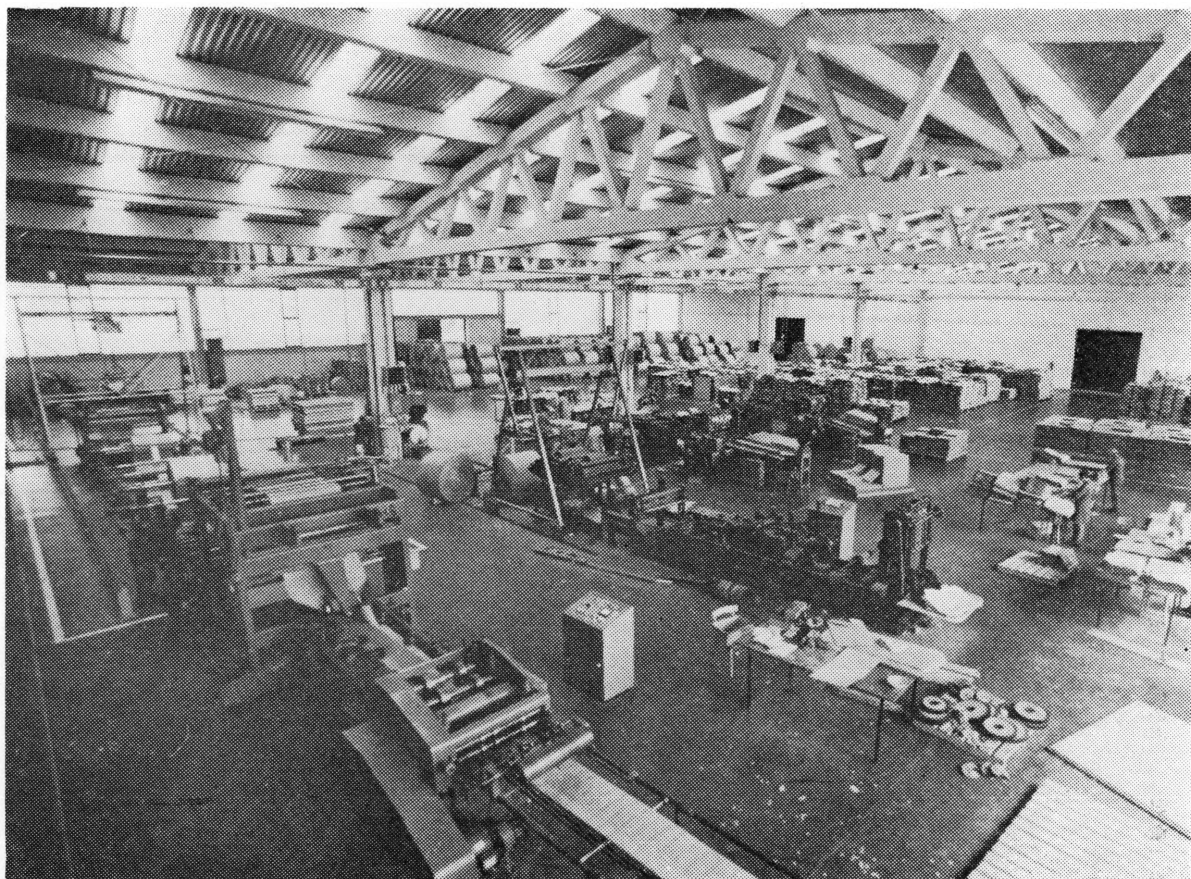
Primjer uspješne disperzije industrije: »Bilokalnikov« pogon u Borovljanima

gore i Kalnika. Šumska zemljišta razvila su se u mlađoj geološkoj dobi u vrijeme formacije antropozoika. Tla na Bilo-gori i Kalniku razvila su se u vrijeme tercijara, a uz rijeku Dravu nalaze se diluvijalna i aluvijalna tla nastala u kvar-taru.