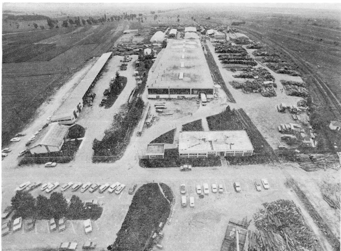
Pogled na drvenu industriju u Đurđevcu koja posluje u okviru SOUR-a »Bilokalnik«

zirana tvornica koja je zahtijevala isto tako kvalitetne kadrove. Stručnjaci i radnici izrasli u »Bilokalniku« bili su spremni i uspješno su krenuli s novom proizvodnjom. Tvornica je izgrađena u namjeri da oko 250 tisuća komada vrata godišnje izvozi, što je, uglavnom, i ostvarivano. Sto se tiče same proizvodnje tvornica je vrlo uspješno startala, ali su je u postizanju optimalnih rezultata ometali tržišni problemi.