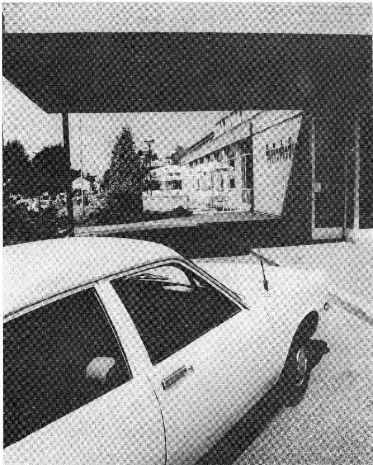
Hotel »Podravina« u Koprivnici — osnovni nosilac turizma u koprivničkoj općini