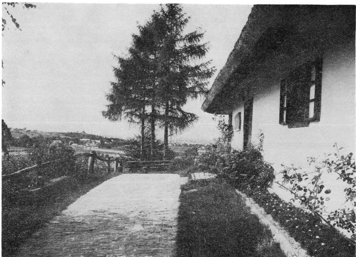
»Podravska klet« (»Podravkin« rekreacijski centar) na obroncima Bilo-gore kraj Koprivnice, primjer spajanja tradicije i suvremene rekreacije i ugostiteljstva

staji još ove godine planira se izgradnja mriještilišta isključivo za potrebe ribnjaka. Paralelno s izgradnjom ribnjaka u Rasinji, Veterinarska stanica vrši i uzgoj hladnokrvnih konja za kojima se ponovno javila potražnja.