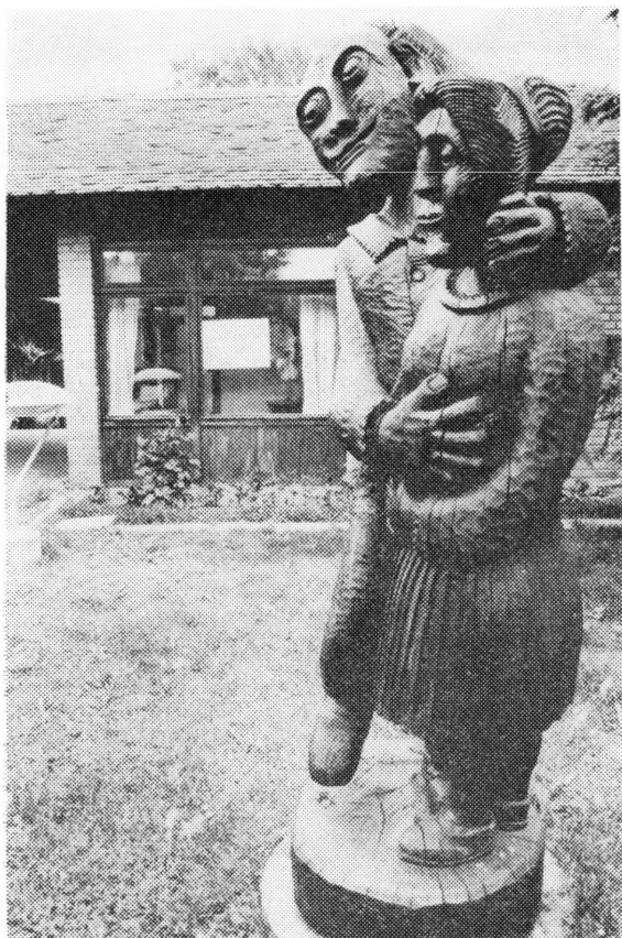
Galerija naive u Hlebinama — važna privlačna turistička točka u Podravini

dječja plaža i igralište. Trenutno se vode pregovori oko »Izvorovog« preuzimanja drugog ribljevog restorana »Bijela lađa«, vlasništvo Poljoprivredne zadruge Gola. Taj restoran specijalizirao bi se za pečenje janjetine i prasetine. Na mjestu gdje je danas spremište sportskih rekvizita uredilo bi se 1981. godine kupalište i sagradio drugi restoran na vodi površine 200 m 2 , ali za razliku od »Skele« zatvorenog tipa tj. radio bi cijelu godinu. Posebna atrakcija tog objekta bila bi električna vodenica. Posluživali bi se isključivo domaći specijaliteti. U dugoročnoj je perspektivi (oko 1985.) gradnja hotela, čime bi Soderica postala vrlo jakim turističkim središtem.