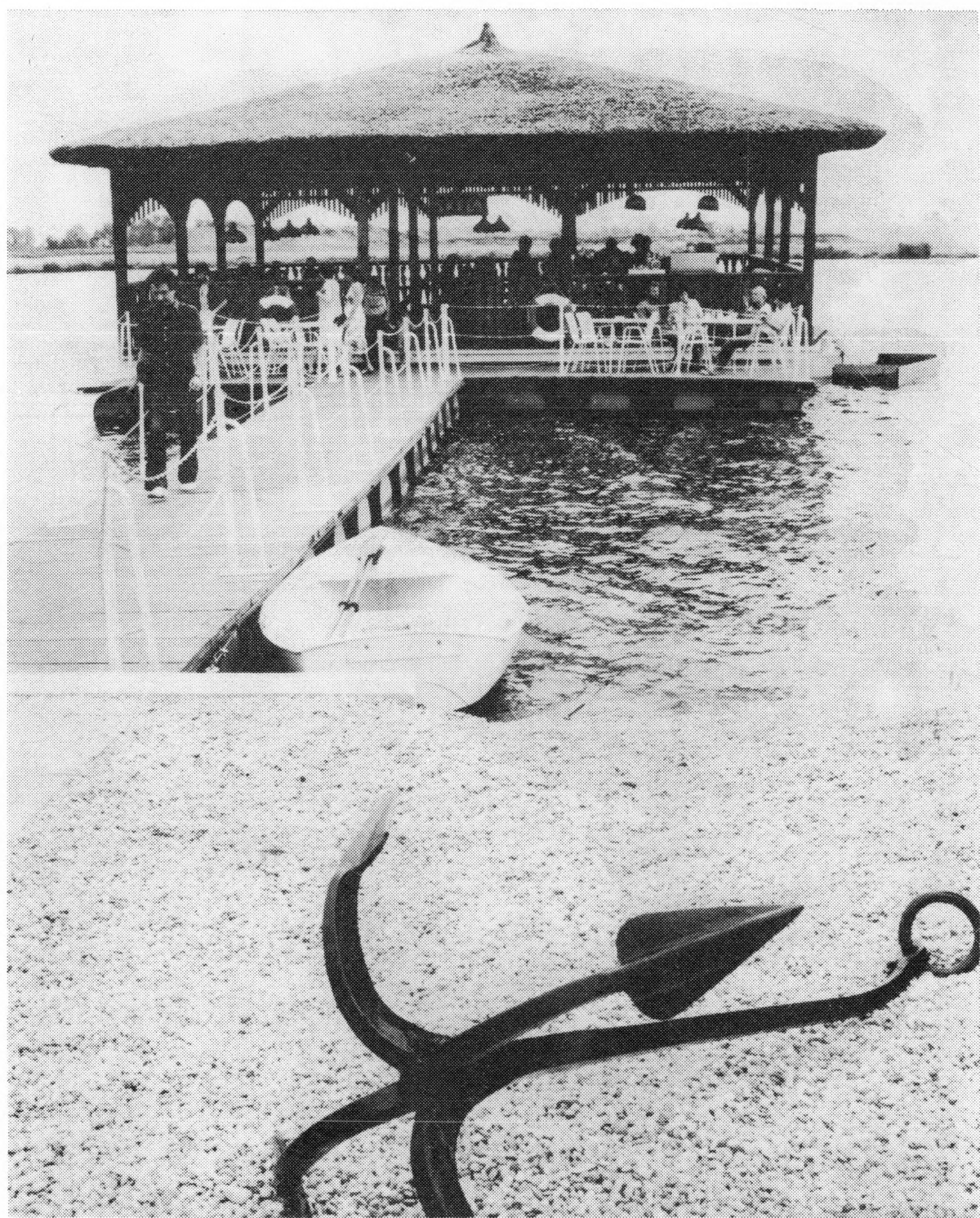
Novi riblji restoran na Šoderici 13 PODRAVSKI ZBORNIK