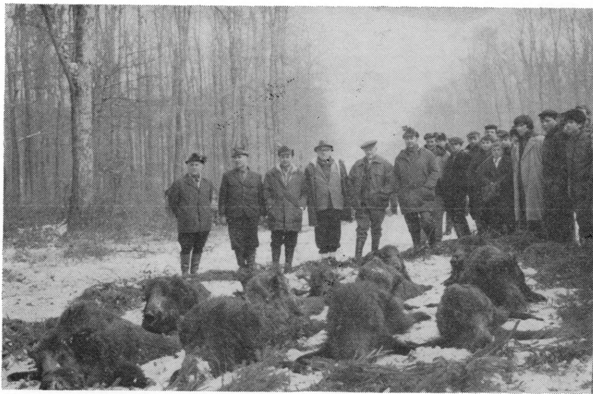
Poslije lova na divlje svinje u Repašu 1972. godine

uvjeti u lovištima nisu promijenili, ipak se brojno stanje ove divljači znatno povećalo. Do tih promjena došlo je zbog rada i zalaganja lovačkih organizacija. Podizanjem hranilišta, solišta, remiza i ostalih tehničkih objekata, te suzbijanjem krivolova, poboljšali su se uvjeti uzgoja krupne divljači te je došlo do povećanja brojnog stanja i matičnog fonda. Svakako je vrlo važno napomenuti da se naročito poslije završetka II. svjetskog rata promijenio način života, i to posebno na selu, tako da je pašarenje praktički nestalo i to, prvenstveno, na šumskim površinama. Ta pojava je jedan od vrlo važnih činitelja za povećanje brojnog stanja krupne divljači.