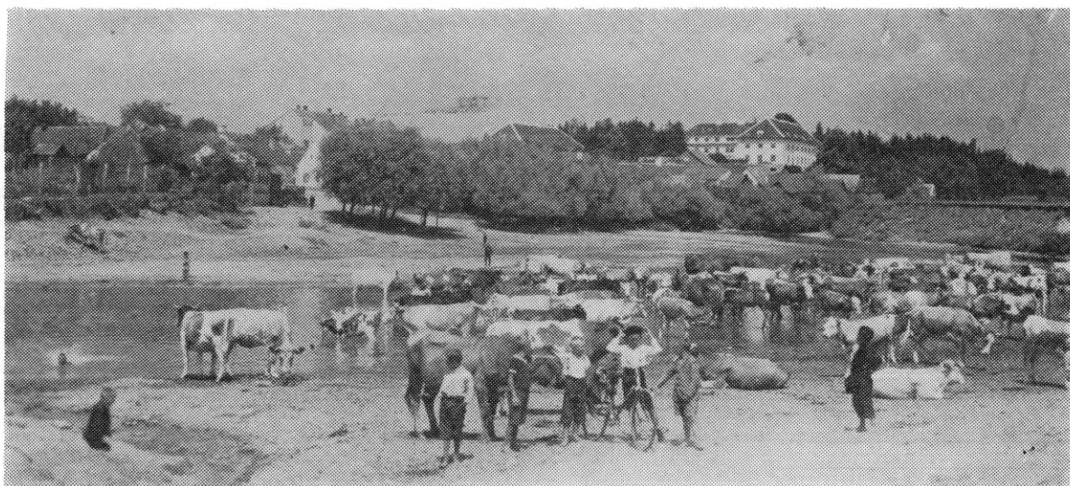
Pogled na ludbreški grad iz doline Bednje, snimljeno 1932. godine

—1765) i Karlu (1698—1772) namrla je čvrstu povezanost s kraljevskom kućom Habsburg.