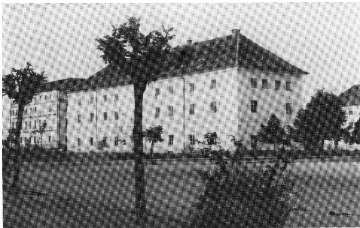
Pogled na jednu od pokrajnjih zgrada ludbreškog grada, danas Skupština općine Ludbreg

izvedena sjajna iluminacija dvora i parka uz »sonornu muziku«.