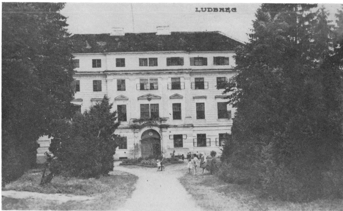
Pogled na glavnu zgradu ludbreškog grada 1930. godine