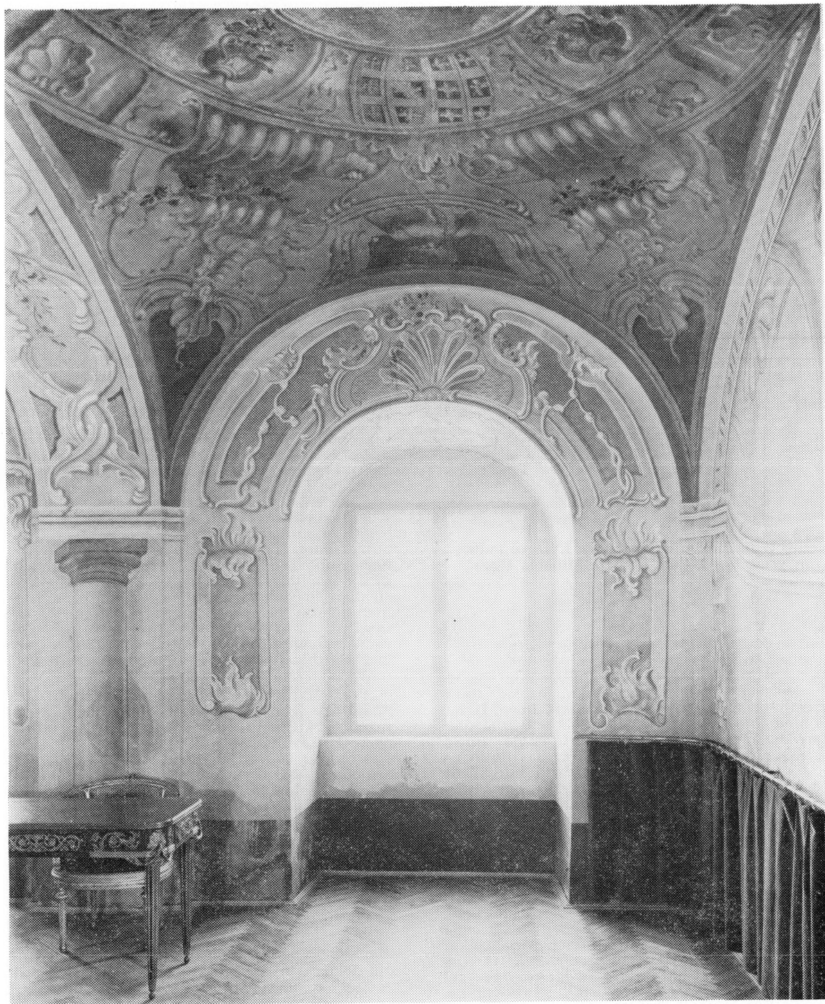
Nekadašnja kapelica ludbreškog grada danas je primjerno uređena vjenčاونica