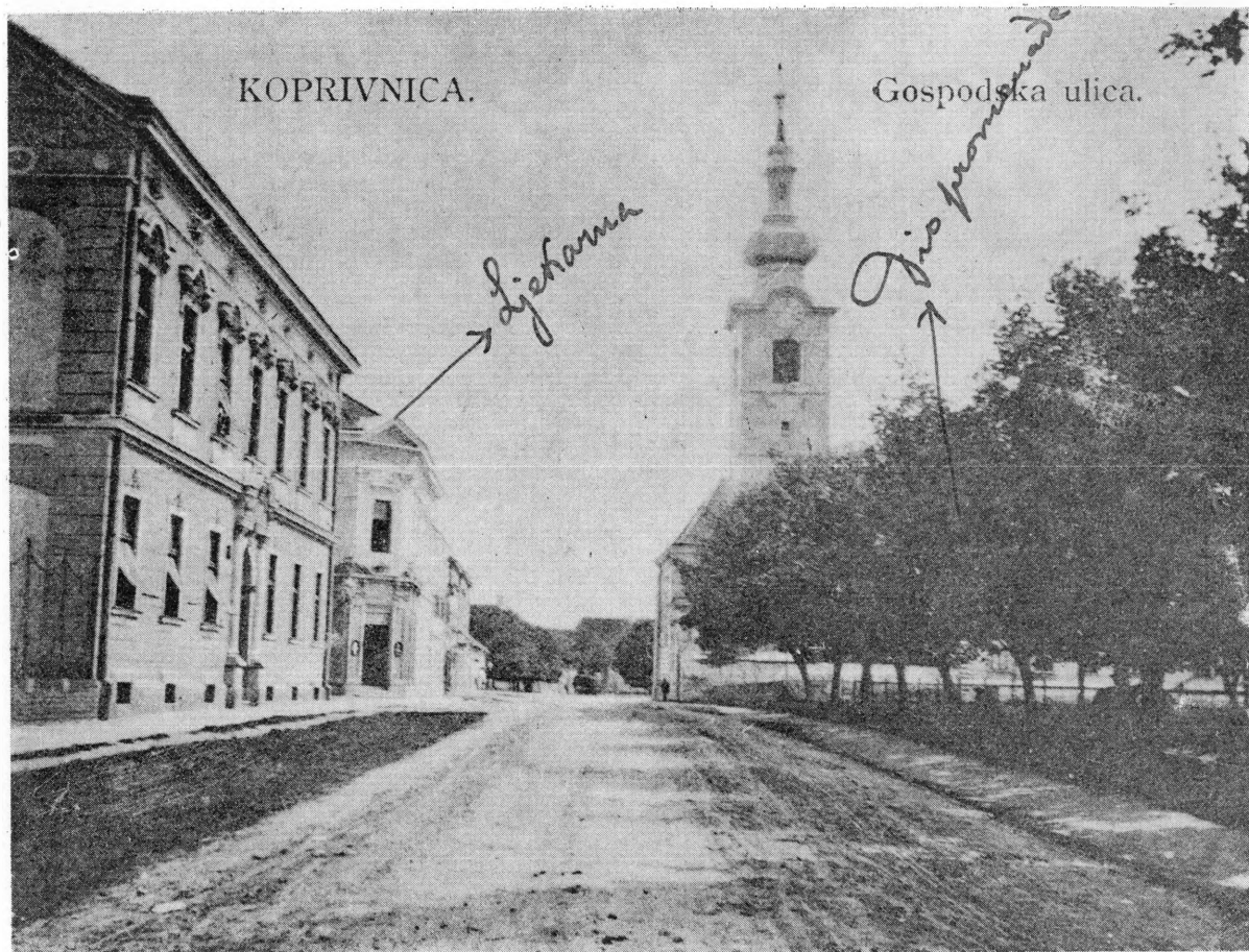
Pogled na tadašnju Gospodsku ulicu s ljekarnom »K zlatnom orlu« početkom ovog stoljeća

baruna Inkeya, nekadašnjeg veleposjednika i vlasnika dvorca u Rasinji, posljednji ostatak feudalizma. Oprema lijeka bila je najelegantnija, koliko je to dopuštala ondašnja taksa.