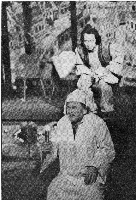
T. Brezovački: »Sveti Aleksi«, uloga Favorin

— Koliko je Dudek prisutan u vašim današnjim ulogama? Ne čini li vam se da gotovo u svakoj roli ljudi u vama prvenstveno vide — Dudeka?