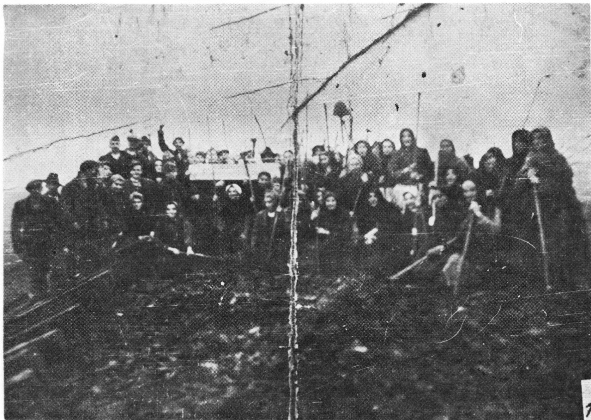
Borci brigade »Braće Radić« ruše prugu Križevci-Koprivnica u jesen 1943. godine

ružanja je zaplijenjen jedan teški mitraljez i 23 puške.