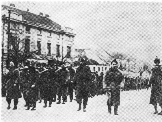
Partizanska vojska u Koprivnici 1943. godine

Neprijatelj svoje napore usmjerava u pravcu brzog prodiranja na oslobođeni teritorij, vrši prisilnu mobilizaciju, što mu češće uspijeva u hrvatskim selima, gdje se narod nije povlačio zajedno s jedinicama NOV-e. Međutim, kako je neprijatelj bio sve drskiji i bezobzirniji, političko djelovanje snaga NOP-a bilo je sve snažnije i efikasnije, naročito na raskrinkavanju ma-