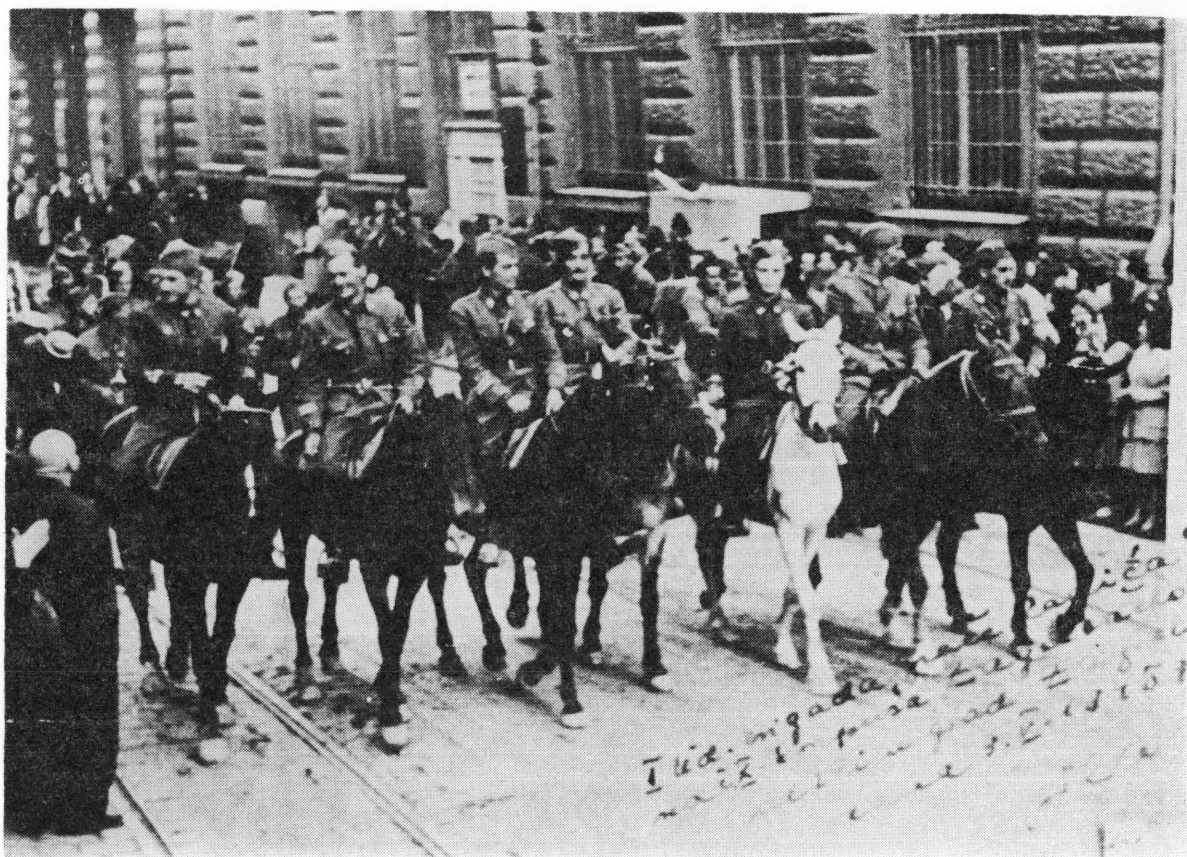
Prva udarna brigada »Braća Radić« ulazi u Zagreb 9. svibnja 1945. godine