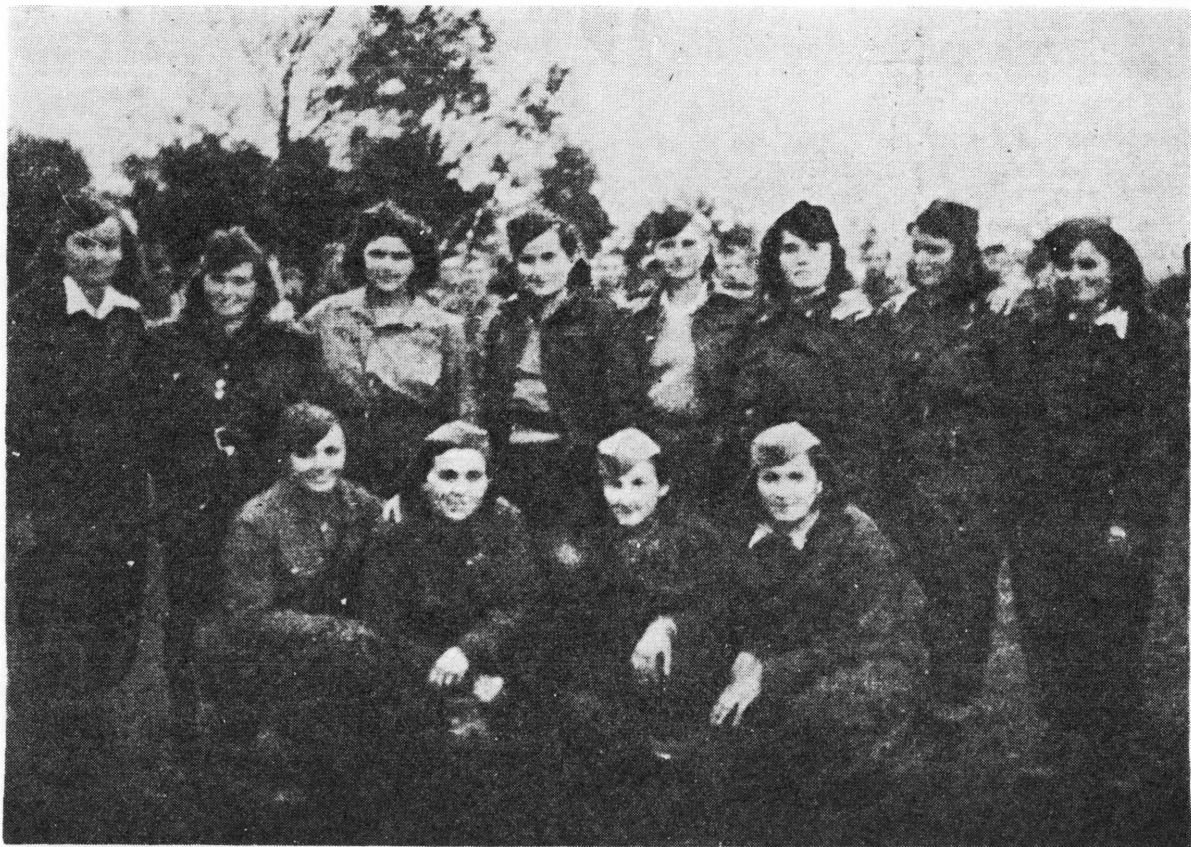
Grupa žena — boraca brigade »Braće Radić«

je bezglasni, uporni odgovor boraca koji su se nadčovječanski odupirali desetostruko jačem neprijatelju.