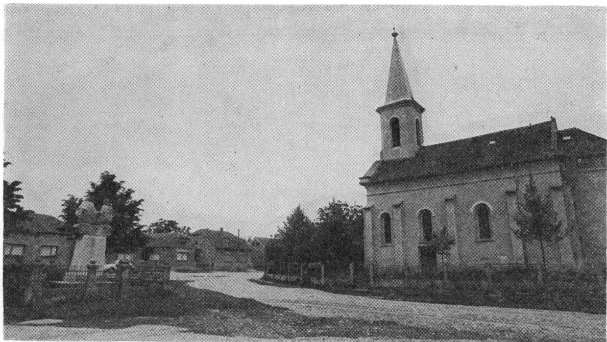
Mjesto u Kunovcu na kojem su se odigrali krvavi događaji 1903. godine