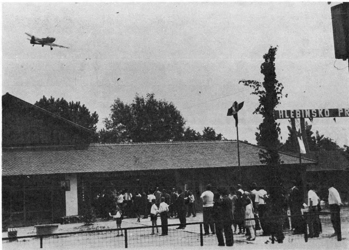
Proslava otvorenja Galerije u Hlebinama 12. svibnja 1968. godine

I kad bi se od toga dalo živjeti, sigurno nitko sretniji od seljaka. Odnosno, nitko ne bi htio ni biti drugo već seljak».