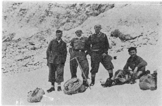
Koprivnički planinari u Alpama tridesetih godina