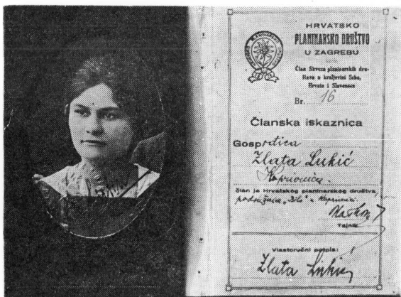
Članska iskaznica Planinarskog društva »Bilo« u Koprivnici iz 1928. godine