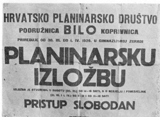
Plakat za planinarsku izložbu u Koprivnici 1929. godine

ba do Šestina autom, a dalje pješke, vrativši se kući uveče.