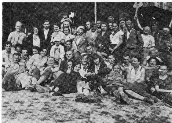
S proslave pete obljetnice HPD »Bilo« na Ravnoj gori 23. srpnja 1933. godine