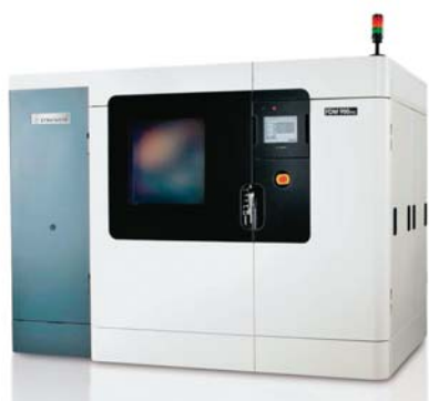
SLIKA 5. Uređaj Stratasys FDM 900mc