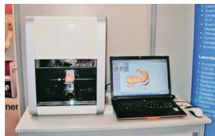
SLIKA 12. Skener LaserDenta

Tržište optičkoga snimanja geometrijskih podataka ili, pojednostavnjeno, trodimenzionalnog skeniranja, slično kao i ostala područja podijeljeno je na medicinu, gdje opet iskače zubotehniku i sve vezano uz nju, te na alatničarstvo i oblikovanje. Na području alatničarstva i velikih skenera nije se u posljednje vrijeme dogodilo ništa dramatično. Još su u utakmici na tržištu u tome segmentu tri važna proizvođača: GOM , Steinbichler i Breuckmann . Ovdje je moguće spomenuti još i tvrtku Leica , s vrlo točnim i preciznim, ali teško uporabljivim sustavom, te tvrtku Minolta , s nekoliko prijenosnih modela koji su ipak tržištu manje zanimljivi od prije nabrojanih. Na području manjih uređaja čini se kako će uskoro svi skenirati samo otiske zubi. Slika 12 prikazuje skener LaserDenta .