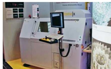
SLIKA 13. nanoCT - mjerni uređaj tvrtke Phoenix

Ubrzano se razvija i područje CT uređaja za tehničku primjenu, s točnošću ispod 10^{-6} mm. S pomoću tih je uređaja moguće mjeriti i unutrašnje šupljine u najrazličitijim elementima, a mogu se uočiti i unutrašnje greške u materijalima. Nedostaci tih uređaja očituju se u još uvijek visokoj cijeni i načelu rada koje se temelji na djelovanju x-zraka. Slika 13 prikazuje nanoCT , mjerni uređaj tvrtke Phoenix .