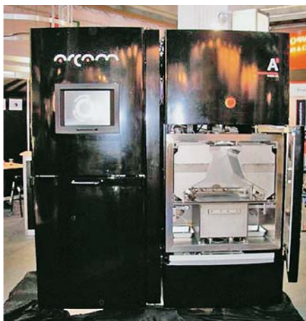
SLIKA 10. ARCAM A2 – sustav za EBM izradbu metalnih tvorevina

za koje su prije svega i razvijeni, no ARCAM je uporabu CoCr proširio i na alatničarstvo. Velika prednost postupka EBM je brzina izradbe tvorevina i njihova gustoća, koja je posljedica velike gustoće unesene energije što omogućuje elektronska zraka. Postupak je tako i do šest puta brži od postupaka temeljenih na laserskom sraščivanju. Nažalost, takva brzina ostvarena je na račun površinske hrapavosti i točnosti izmjera i oblika, koji su u usporedbi s laserskim sustavima za klasu niži. Od preostale tri spomenute tvrtke, MCP temelji razvoj na konceptu namjenskog uređaja za zubotehničku primjenu, Concept Laser nudi prije svega rješenja za alatničarske primjene i nešto inovativnih primjena preradbe praškastih materijala, a EOS ustraje na konceptu jedne platforme koja pokriva više područja primjene. Uočeno je kako svi proizvođači više ili manje ciljaju na stomatologiju i izradbu krunica od CoCr. Tako MCP nudi podatak o izradbi 70 krunica za umjetne zube na sat, a EOS podatak o izradbi 400 komada u 24 sata. Radni prostor kod svih tvrtki je približno kocka izmjera stranica oko 250 mm. Jedino ARCAM sa svojim najnovijim uređajem A2 nudi radni prostor valjkasta oblika, promjera 300 mm i visine 200 mm. Slika 11 prikazuje kalup za injekcijsko prešanje plastomernih figura iz filma Ratatouille načinjen na uređaju EOSINT M270 .