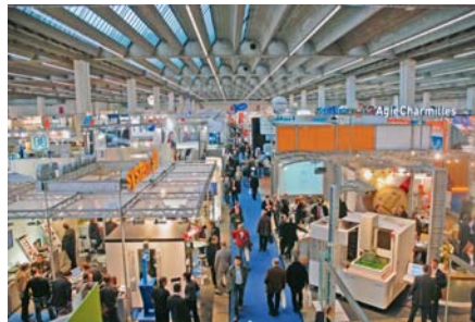
SLIKA 2. Pogled na izložbene prostore na sajmu EuroMold 2007

na vidiku... Već nekoliko godina EuroMold postaje sve manje alatničarski, a sve više RP ( Rapid Prototyping ), RT ( Rapid Tooling ), odnosno RM ( Rapid Manufacturing ) sajam. Istina je kako je većina izlagača (25 %) još iz alatničarskoga područja, no jednako tako činjenica je da oni dolaze uglavnom s Dalekog istoka (slika 3).