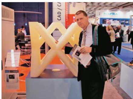
SLIKA 6. Proizvod načinjen uređajem Stratasys FDM 900mc

Tvrtke VoxelJet i ProMetal ponovno su predstavile svoje velike 3D pisaače, namijenjene ponajprije serijskoj proizvodnji, no oni nisu novost na tržištu. Pri oba tipa pisaača primijenjeno je kapljicaasto-praškasto načelo gradnje tvorevina, koje je pod nazivom 3DP patentirano na MIT-u (e. Massachusetts Institute of Technology ), a zatim i licencirano najprije u tvrtki Z-Corporation , a potom i u nekim drugim tvrtkama. U načelu, riječ je o postupku kod kojega sloj prototipne tvorevine nastaje tiskanjem vezivnog a materijala u kapljicaastom stanju na sloj gradivnoga materijala u praškastom stanju. Kod VoxelJet etova postupka riječ je o dvofaznome PMMA, a kod ProMetal ova postupka riječ je o ljevačkom pijesku kao osnovnome materijalu te furanskoj smoli kao vezivu koje se nanosi s pomoću glave za tiskanje. Slika 7 prikazuje pješčani oblik načinjen uređajem S-Print i odljevak.