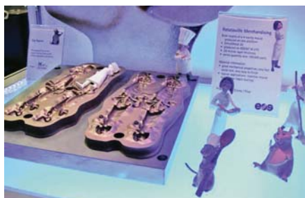
SLIKA 11. Kalup za injekcijsko prešanje plastomernih figura iz filma Ratatouille načinjen na uređaju EOSINT M270 (u kalupu je načinjeno više od 100 000 otpresaka)