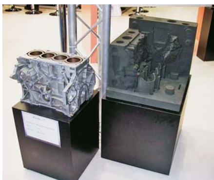
SLIKA 7. Pješčani oblik načinjen uređajem S-Print i odljevak

Tvrtke VoxelJet i ProMetal ponovno su predstavile svoje velike 3D pisaače, namijenjene ponajprije serijskoj proizvodnji, no oni nisu novost na tržištu. Pri oba tipa pisaača primijenjeno je kapljicaasto-praškasto načelo gradnje tvorevina, koje je pod nazivom 3DP patentirano na MIT-u (e. Massachusetts Institute of Technology ), a zatim i licencirano najprije u tvrtki Z-Corporation , a potom i u nekim drugim tvrtkama. U načelu, riječ je o postupku kod kojega sloj prototipne tvorevine nastaje tiskanjem vezivnog a materijala u kapljicaastom stanju na sloj gradivnoga materijala u praškastom stanju. Kod VoxelJet etova postupka riječ je o dvofaznome PMMA, a kod ProMetal ova postupka riječ je o ljevačkom pijesku kao osnovnome materijalu te furanskoj smoli kao vezivu koje se nanosi s pomoću glave za tiskanje. Slika 7 prikazuje pješčani oblik načinjen uređajem S-Print i odljevak.