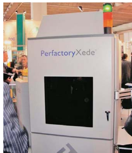
SLIKA 9. Najveći uređaj tvrtke EnvisionTec iz serije XEDE

brzom uređaju za izradbu proizvoda fotopolimernih smola. EnvisionTec je prije nekoliko godina patentirao postupak sličan stereolitografiji, koji umjesto laserske zrake za očvršćivanje fotoosjetljive smole koristi DLP matricu tvrtke Texas Instruments , poznatu po suvremenim digitalnim projektorima. DLP matrica projicira sliku cijelog sloja prototipa odjednom, što je bitno brže u usporedbi s laserskim očvršćivanjem, pri kojemu laser mora pročešljati cijelu površinu sloja. Brzina uređaja tako je konstantna i neovisna o veličini pojedinog sloja tvorevine, a iznosi 20 mm/h (u smjeru osi z).