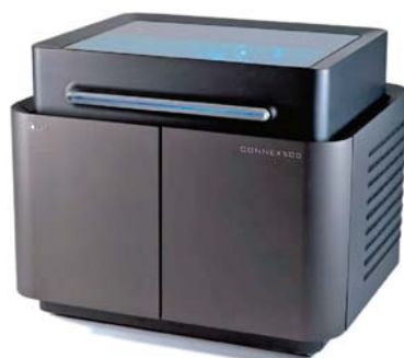
SLIKA 8. Pisaač Connex500

Radni prostor uređaja Connex500 preuzet je od prethodnika, uređaja EDEN 500 , s radnim prostorom veličine 500 · 400 · 200 mm. Uz to, valja još napomenuti kako tvrtka Objet u ovoj godini najavljuje plasiranje novog tipa materijala, koji će se najvjerojatnije zvati DURUS , a njegova mehanička svojstva bit će slična polipropilenu.