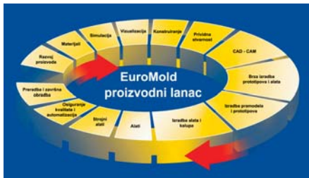
SLIKA 1. Proizvodni lanac

Od 5. do 8. prosinca 2007. u Frankfurtom sajamskom centru održana je 14. priredba alatničarstva i brze proizvodnje EuroMold 2007. Riječ je svakako o najvećem europskom događaju posvećenom alatničarstvu i postupcima brze proizvodnje, a moguće ga je svrstati i u vodeće svjetske priredbe. Sajam EuroMold 2007 posjetilo je više od 61 700 posjetitelja iz 83 zemlje, kako bi se informirali o stanju tehnike, novim konceptima i strategijama. Ovogodišnji slogan priredbe glasio je From Design to Prototyping to Series Production (Od konstrukcije do prototipa do serijske proizvodnje), čime se naglašava potreba za razmatranjem čitavog procesa od ideje do gotovog proizvoda (slika 1), a ne samo koncentracija na pojedine segmente toga procesa.