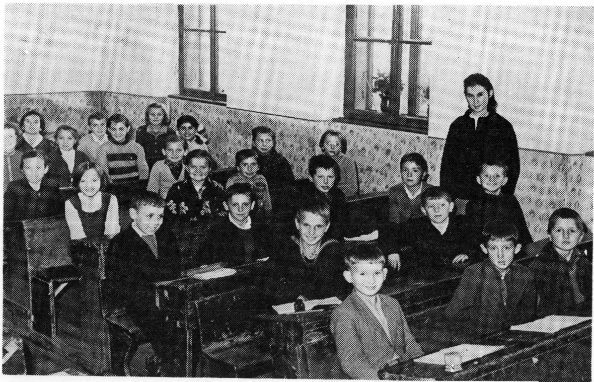
Nastava u učionici stare škole (1960/61)

na. Kada su se počele formirati općine, Martijanec postaje sjedište općine, Županije varaždinske. Bilježnička i učiteljska služba bile su tada spojene. Kako se škola sve više organizirala, pokazala se potreba da se izgradi nova školska zgrada. Tako je 1846. god. »velikom dobrotom i milošću« barunice Elizabete Rauch sagrađena na župničkom zemljištu nova školska zgrada. Prvi učitelj u novoj školskoj zgradi bio je općinski bilježnik Nikola Kovačić, koji je bilježničku i učiteljsku službu vršio do 1849. god. Poslije Nikole Kovačića došao je Ignac Staudaar, koji je službovao u Martijancu do 1873. god., zatim Mijo Horvat do 1889., a za njim Tomislav Vöröš. Školski patron u to vrijeme bio je »presvijetli« gospodin barun Pavao Rauch, gospodar dobra Martijanec. Već u