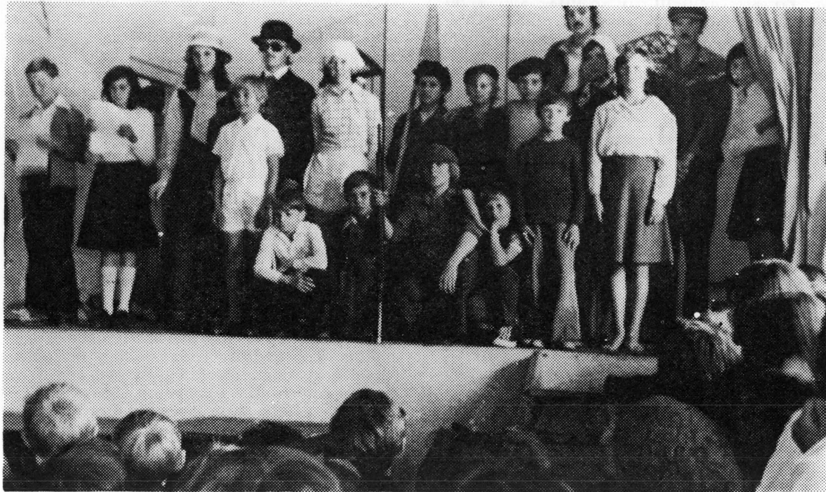
Nastup dramske grupe škole u Martijancu (1976/77)