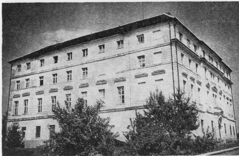
Iako se nalazi u starom grofovskom zdanju, pogon »Varteksa« u Ludbregu zapošljava velik broj radne snage