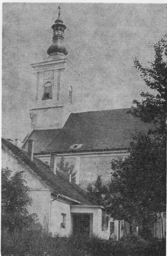
Pogled na baroknu crkvu u Velikom Bukovcu

Na prostoru između Dravske ulice, kanala Bednje i ceste prema Dubovici, na po-