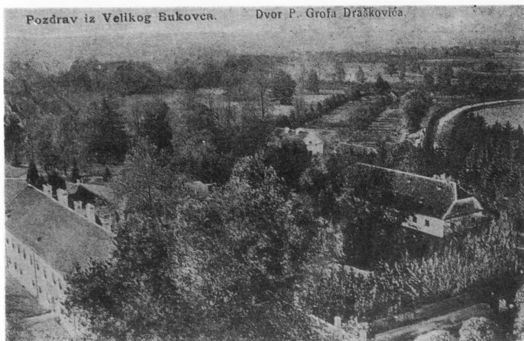
Kompleks dvorca grofa Draškovića u Velikom Bukovcu snimljen početkom ovog stoljeća