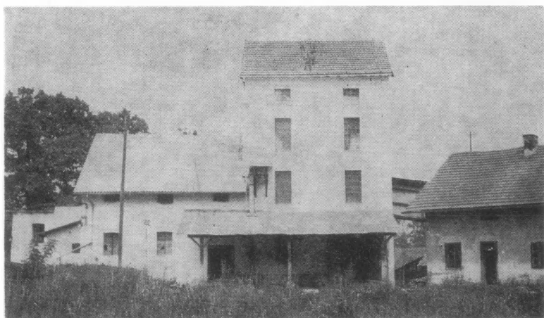
Mlin u Velikom Bukovcu, kojeg su izgradili još grofovi Draškovići

nalom. U dijelu istočnog jezera izgrađen je otok s grupom crnogoričnog drveća. S južne strane jezera podignuta je uzvisina zvana »gorica«, omiljelo sanjkalište djece zimi. Sve raslinje i staze brižno su njegovane i održavane od posebnih stručnjaka. Na prostoru uz cestu prema Dubovici, na površini od 2 hektara, podignut je rasadnik i staklenici za uzgoj povrća i ostaloga raslinja. Cijela površina se navodnjavala vodom iz Bednje.