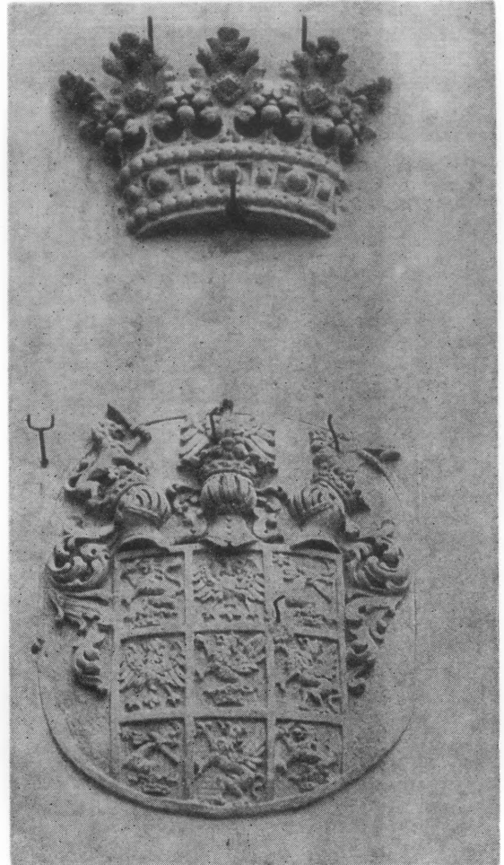
Grb na ulazu u dvorac Drašković u Velikom Bukovcu

Pojedini članovi obitelji imali su u vremenu od XVI do XX stoljeća značajnu povijesnu ulogu kao političari, vojnici ili crkveni dostojanstvenici. Ivan II Drašković istakao se u borbama protiv Turaka kod Siska i Petrinje, a 1596. imenovan je hrvat-