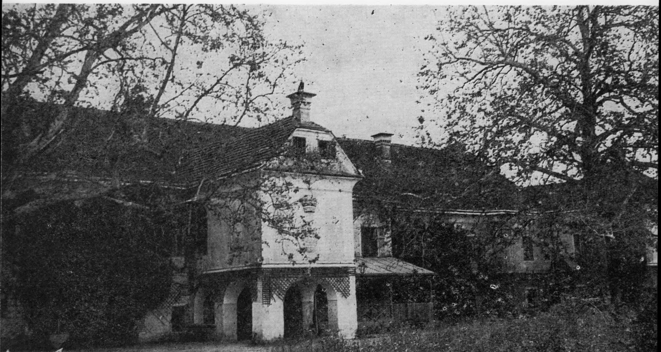
Dvorac Drašković u Velikom Bukovcu danas

Na sutoku rijeka Bednje i Plitvice u rijeku Dravu na 10 km udaljenosti od Ludbrega na cesti prema Legradu, nalazi se selo Veliki Bukovec, 300-godišnja postojbina vlastelinske obitelji Drašković. Glavni prilaz u selo je s južne strane i prelazi se preko dva lijepa nova mosta na rijeci Bednji i kanalu, na kojem se nalazi mlin, jedna od najstarijih industrija općine Ludbreg. Uz mlin, koji danas prerađuje godišnje 420 vagona pšenice u kvalitetno brašno, nalazi se pilana i stolarska radionica. Svi su ovi objekti u društvenom vlasništvu PPK »Bed-