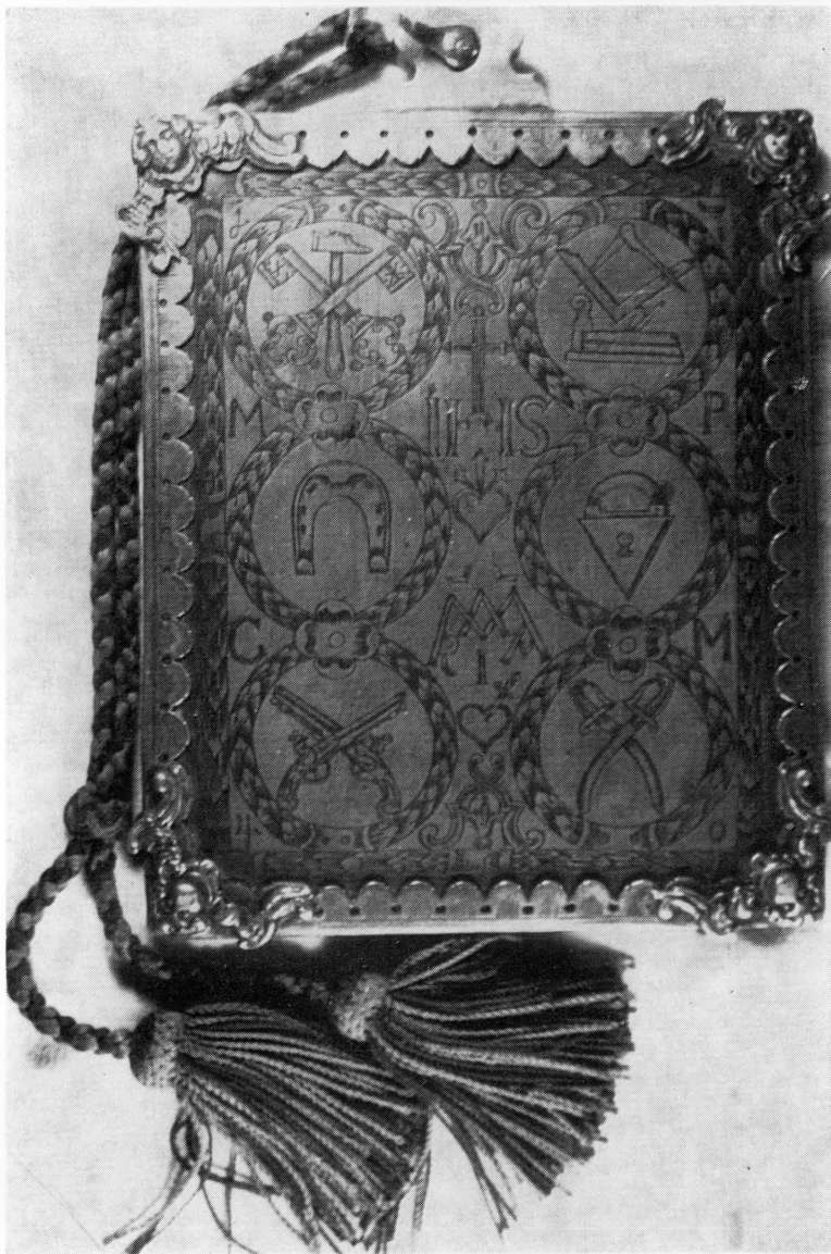
Metalni okvir u kojem su djetici nosili tadašnje radne knjižice prilikom njihova »vandranja« kod drugih »meštrov« u raznim trgovišćima