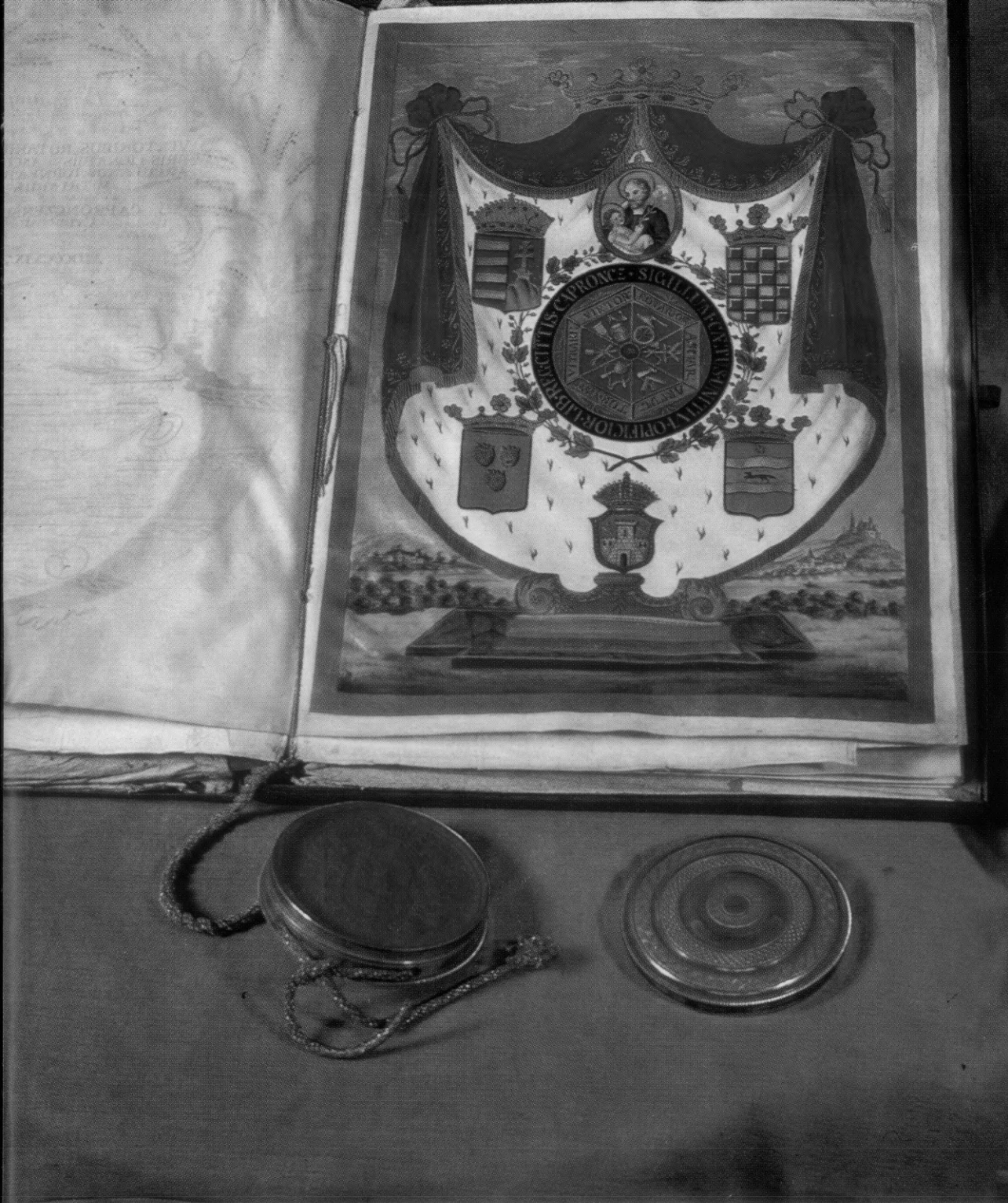
Pravila koprivničkog mješovitog ceha iz XVIII stoljeća