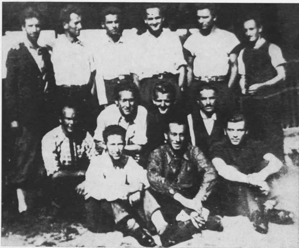
Grupa logoraša na Danici 1941. godine. (Muzej grada Koprivnice).