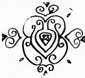
(Ilustracija J. Turković)

— Mnogo toga što se u međunarodnom slikarstvu precjenjivalo kao likovno otkriće prije pedeset godina danas klepeće kao kostur, a Krstine slike, eto nisu se ugasile.