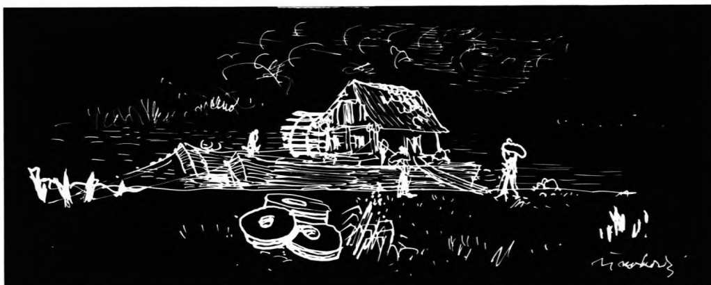
(Ilustracija J. Turković)

Zapisnici Gospodarske podružnice za kotar Ludbreg.