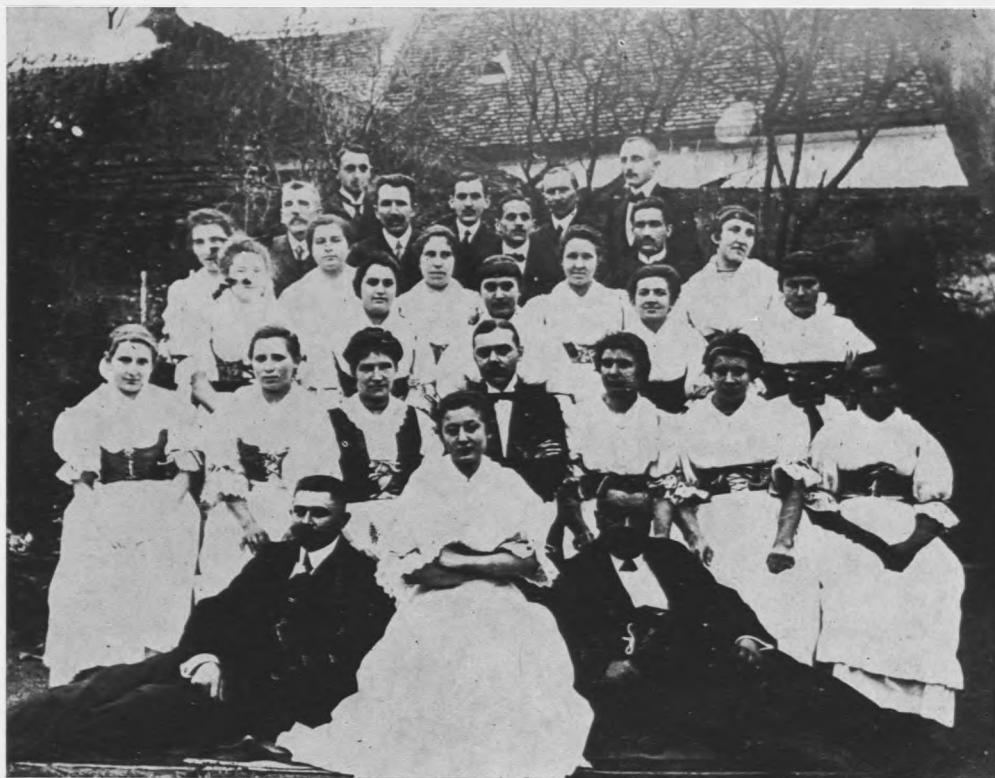
Ludbreški pjevački zbor »Podravina« 1917. godine