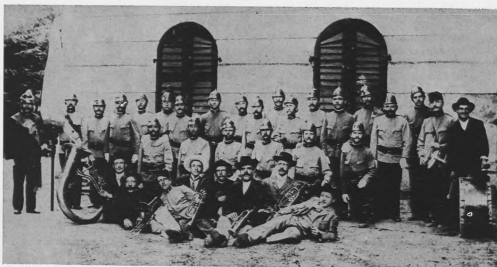
DVD Ludbreg početkom ovog stoljeća

službeno zove naukovanje, polaže ispit i odlazi u fremd (die Fremde = tuđina) da dopuni znanje. Nakon nekoliko godina vraća se u domovinu da savije bračno gnijezdo i započne rad kao samostalni obrtnik. Svi ludbreški majstori prošli su takav »razvojni put«, mnogi od njih naučili su njemački ili mađarski jezik — i bili su vrlo ponosni na svoj stalež. Među njima našao bi se po gdjejkoji »dotepenec«, stranac, ali takvi bi se brzo prilagodili novoj sredini, »pustili bi ovdje korijenje«, a njihovi sinovi već bi se ubrajali među domaće. Zahvaljujući toj »metamorfози« u Ludbregu je uvijek bilo, a još i danas je mnogo Hrvata sa stranim prezimenima.