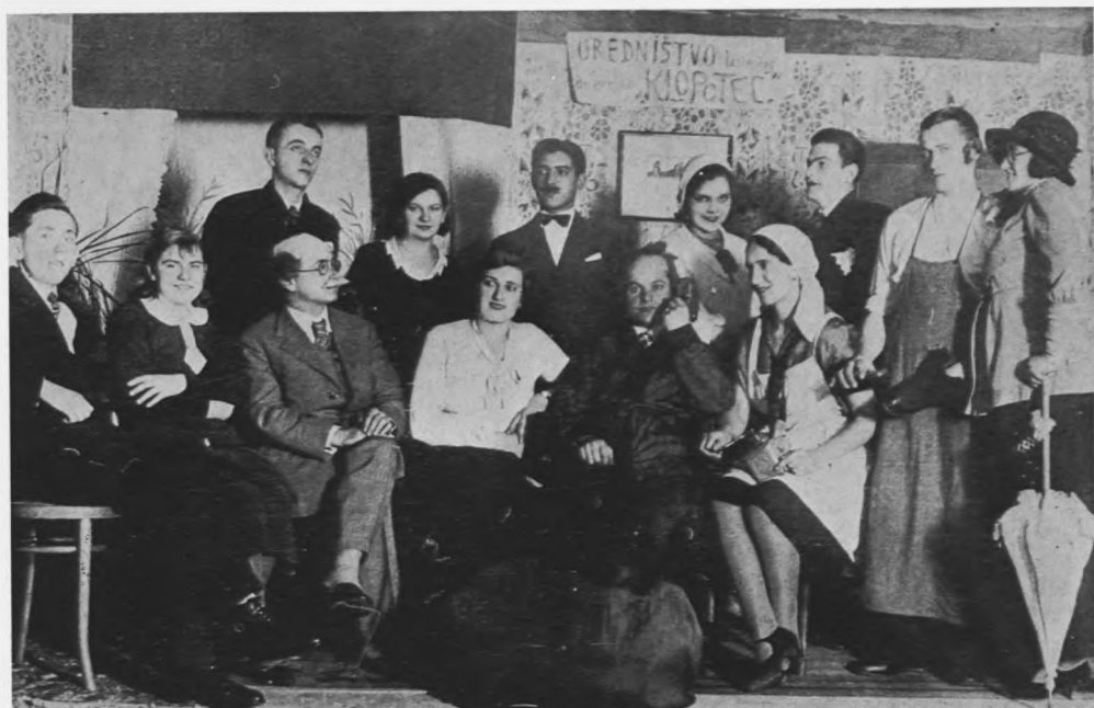
Diletantska grupa u Ludbregu 1931. godine

prvo, tko će poučavati dobrovoljce, i drugo, odakle novac da se taj kapelnik plaća. Međutim, sve je glatko teklo. Živio je tada u Selniku neki vrlo glazbeni Čeh, Dragutin Janhuba — »pobirač vinotočja«. Općina mu nije mogla dati primjerenu plaću, ali je sada bila prilika da poučavanjem glazbenika zaradi još šezdeset kruna, po prilici toliko koliko je dobivao na svojem radnom mjestu. Problemi su se brzo rješavali jedan za drugim. Janhuba je prihvatio ponudu, javili su se sposobni mladići voljni da uče sviranje; imućniji građani obvezali su se da će redovno uplaćivati svoj doprinos za glazbu. Pomoć je pružila i općina, a vatrogasno društvo stavilo je na raspolaganje svoje prostorije u staroj »spricalki«.