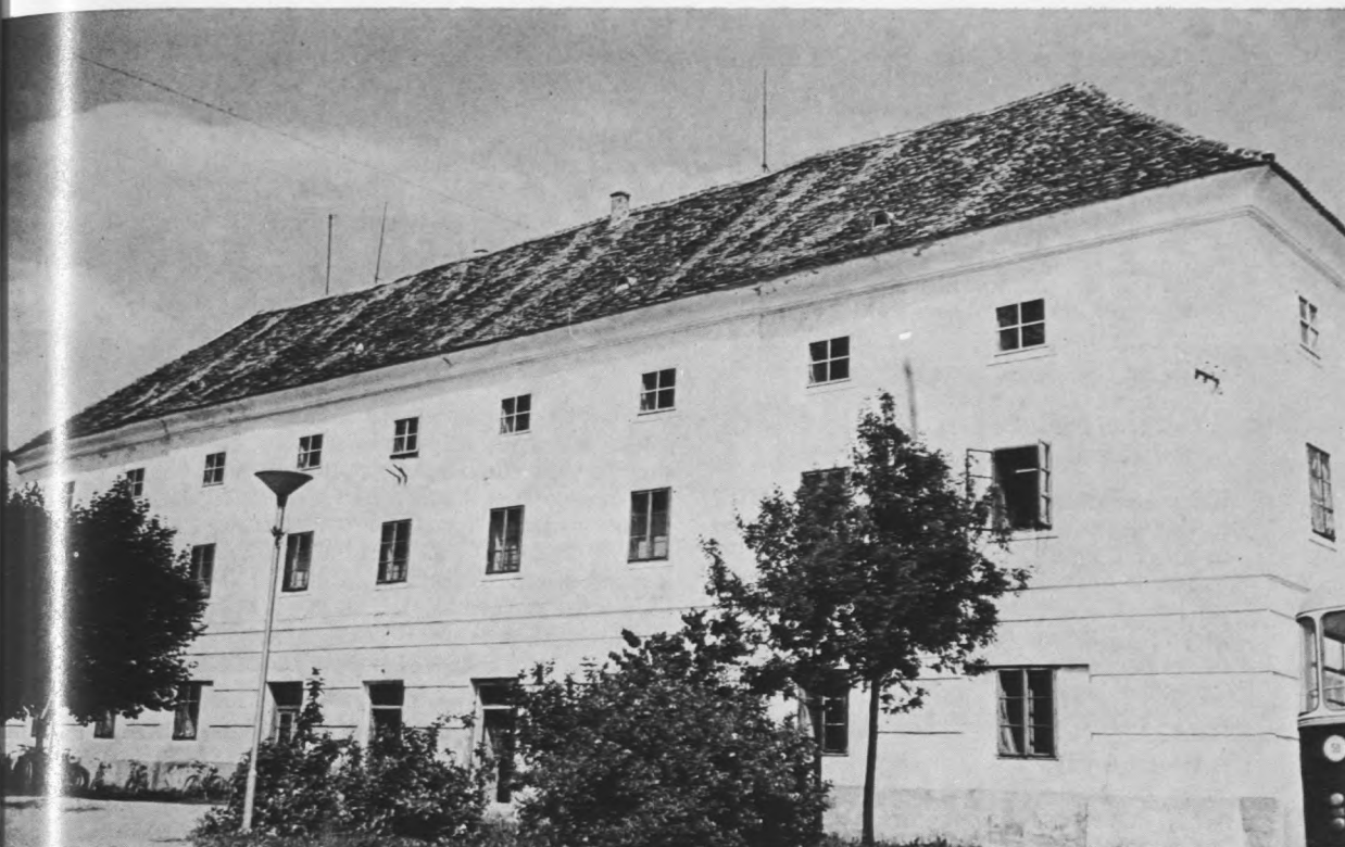
Jedna od starih zgrada ludbreškog vlastelinstva u središtu mjesta

kim susjednim općinama. Tako su npr. prinosi pšenice po ha (1973) 32,4 q, a u koprivničkoj općini 31,6, kukuruza 43,2 q prema 37,7 u općini Koprivnica. Međutim sve se to osniva na sitnim poljoprivrednim gospodarstvima gdje nije moguća primjena vrhunske tehnike i tehnologije. Ima doduše orijentacije na robnu proizvodnju i kooperaciju sa socijalističkim sektorom, ali su te pozitivne tendence ugrožene raslojavanjem poljoprivrednih gospodarstava, koja se uslijed zapošljavanja u industriji i drugim djelatnostima sve više pretvaraju u mješovita poljoprivredno-radnička ili radničko-poljoprivredna, u kojima neizbježno dolazi do slabljenja robne proizvodnje. U politici prema agrarnoj proizvodnji nastoje se u općini postići određeni ciljevi.