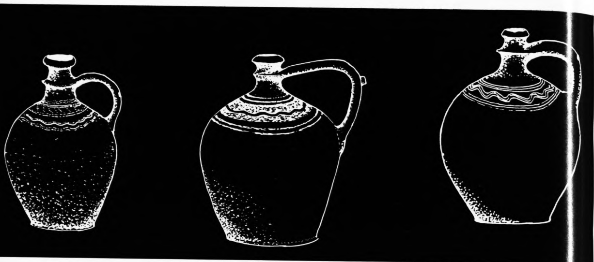
Stara narodna grnčarija iz podravske sela (Crtež J. Fluksi)

doma ne znaš?» Čovek se je v kanil i prodal. Vragu je dal rokavico za kaparo, a vrag je njemu splatil, kak so se pogodili. Čovek dojde doma i se pove ženi i pokaže novce. Žena mu na to veli: »Čovek, nesi dobro napravil. Ja sem noseča, a ti si to prodal.« Mož veli: »Pak dobro, kak bilo da bilo, ja bom to več drugač okrenol«, i otišel je to se povedati župniku. Župnik mu je rekel: »Dok doje vrag po dete, ne daj ga, dok školo ne zvrši.« Dete se je rodilo, vrag je došel, al ga čovek neje dal, nego je rekal: »Nek bo, dok ga bar mati otkoji.« Vrag je došel i po tom, a čovek je rekal: »Nek bo, dok zvrši bar jeno školo, bo tam pametneše.« Došel je vrag i treči pot, ali je čovek dete dal mam semenišče i nameril ga je zaškolati za popa. Čovek je rekel vragu: »Nej bo, dok škole zvrši, bo v peklu pametneši.« I tak je dečec obavljaj škole, a dok je oblekel reverendo, onda mu vrag neje više nikaj mogel. I mali je škole zvršil, ali neje mogel mešo služiti, kad je pri vragu kapara. Moral je iti v peklo po rokavico.