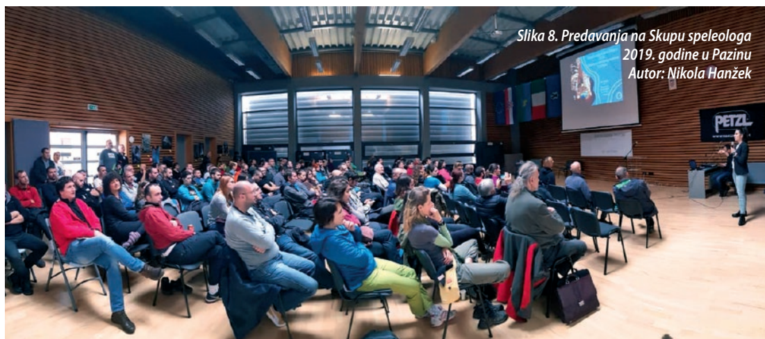
Slika 8. Predavanja na Skupu speleologa 2019. godine u Pazinu

Kroz godinu su održane tri odsječke vježbe samospašavanja, od kojih su dvije uključivale pokaznu vježbu postavljanja sistema (tirolska prečnica, sv. Bernard). U veljači smo ugostili i najmlađe ljubitelje planina, Gojzeke , s njihovim roditeljima, koji su posjetili naše odsječke prostorije te razgledali izloženu muzejsku zbirku. Najmlađe smo zabavljali i nizom radionica u sklopu festivala Mineral Expo (24. – 26. 5. 2019). U Novom Vinodolskom u