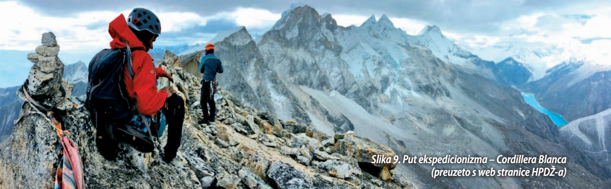
Slika 9. Put ekspedicionizma – Cordillera Blanca

suradnji sa Zajednicom tehničke kulture provedena je Mala škola speleologije u vodstvu našeg člana Hrvoja Grgića.