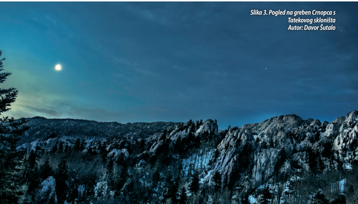
Slika 3. Pogled na greben Crnopca s Tatekovog skloništa

KG-DP. Ovaj logor, osim iznimnim speleološkim rezultatima, rezultirao je i izvrsnom suradnjom s bugarskim speleolozima koji su s nama dijelili motive i entuzijazam. Na logoru je sudjelovalo 30 osoba iz sljedećih udruga: SU „Estavela“, SK „Ozren