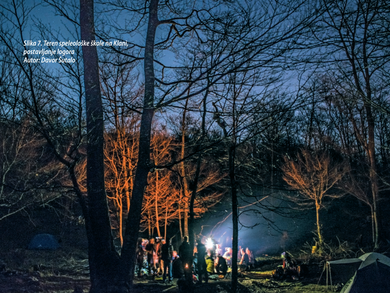
Slika 7. Teren speleološke škole na Klani, postavljanje logora