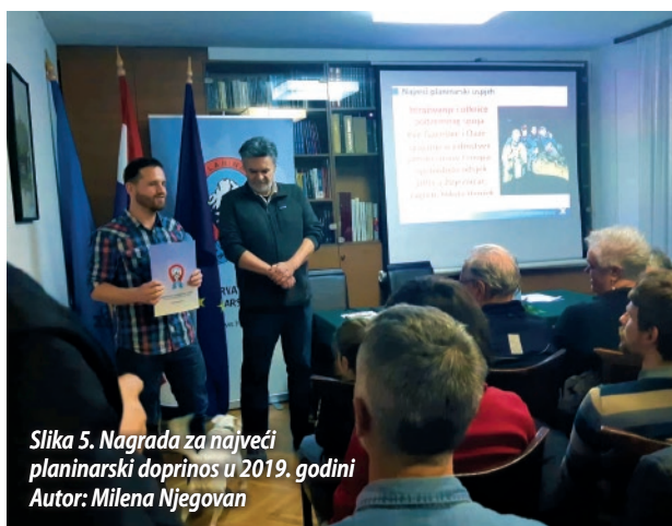
Slika 5. Nagrada za najveći planinarski doprinos u 2019. godini Autor: Milena Njegovan

U 2019. godini članovi SOŽ-a održali su preko 10 znanstvenih, stručnih i popularnih predavanja. Nastavljena je suradnja s drugim speleološkim udrugama, te su tako Vlado Božić, Josip Dadić i Matea Talaja gostovali na speleološkim i planinarskim školama Speleološkog kluba „Ozren Lukić“, HPD-a „Zagreb-Matica“ i SO-a PDS „Velebit“. Stipe Maleš održao je predavanje o korištenju aplikacije TopoDroid pri digitalnom topografskom snimanju speleoloških objekata na seminaru koji je održan u