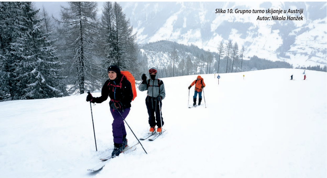
Slika 10. Grupno turno skijanje u Austriji Autor: Nikola Hanžek

Značajno je spomenuti i sve aktivnosti koje su tijekom godine koja je sada već iza nas pokrenute i još su u razvoju. S obzirom na to da je pred nama godina u kojoj Odsjek i cijelo društvo HPD „Željezničar“ slave 70. obljetnicu djelovanja, planiran je niz aktivnosti kojima će biti obilježena. Tako će u 2020. godini SO HPD „Željezničar“ biti organizator Skupa speleologa Hrvatske, koji će se prvi put održati u Zagrebu. U znaku obljetnice 2017. godine pokrenut je već spomenuti projekt Put ekspedicionizma , koji u finalnoj godini dobiva i zasebnu speleološku ekspediciju Ekspedicija Crnopac 2020 . Budući da je primarni cilj projekta postizanje planinarskih (alpinističkih i speleoloških) ostvarenja svjetskog značaja, speleološki dio ekspedicije održat će se upravo u RH, na masivu Crnopca.