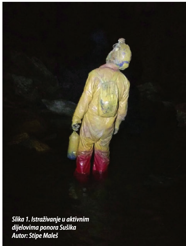
Slika 1. Istraživanje u aktivnim dijelovima ponora Sušika

Drugi logor, održan od 9. do 18. 8. 2019. pod vodstvom Nikole Hanžeka i Milene Njegovan, ostat