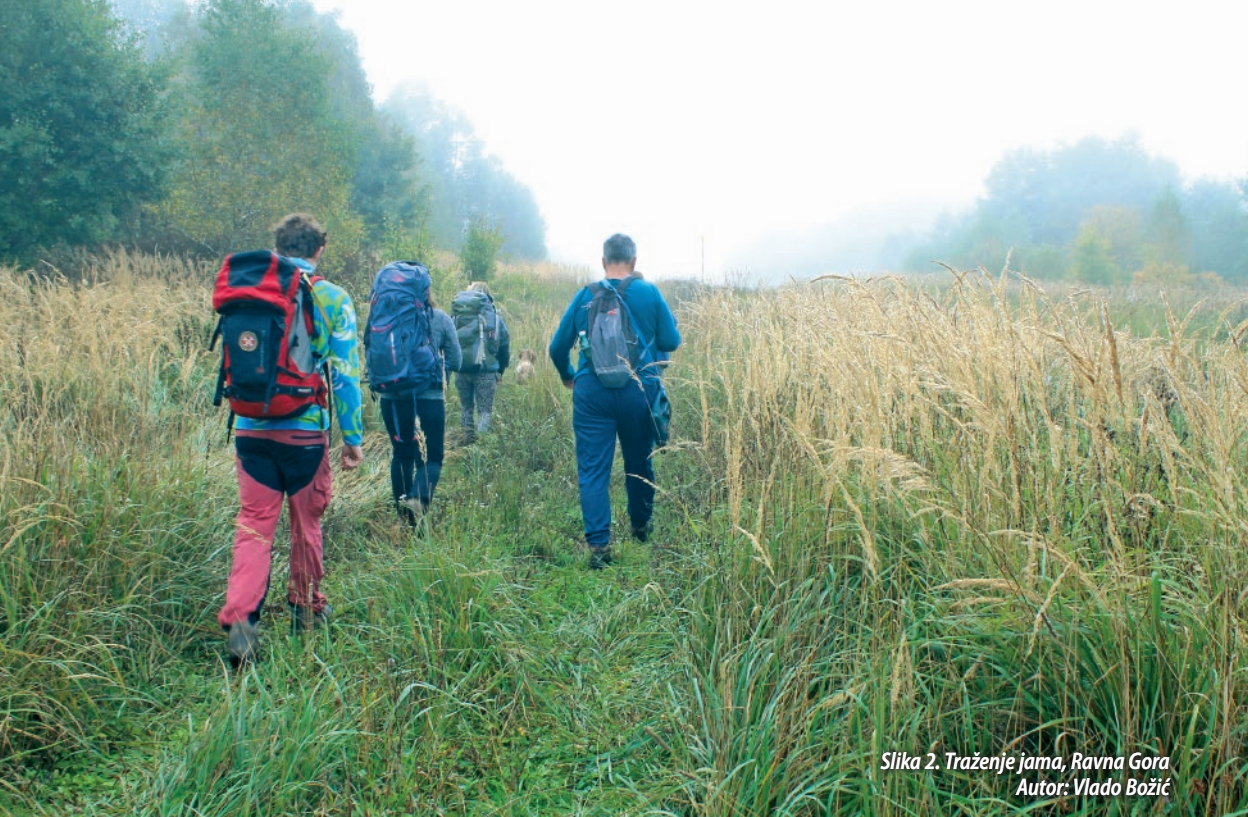
Slika 2. Traženje jama, Ravna Gora

će zapamćen kao logor na kojem je ostvaren san hrvatske speleologije – Jamski sustav Crnopac . Povedeni rezultatima proteklog logora te na znakama spoja u noći s 13. na 14. 8. 2019. ekipa SOŽ-ovaca pronalazi spoj jame Oaze sa sustavom