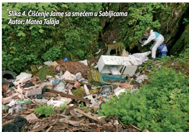
Slika 4. Čišćenje Jame sa smećem u Sabljicama

U 2019. godini speleološku školu upisalo je 6 polaznika (Slika 6.). Jedna polaznica odustala je nakon drugog terena, te je tako školovanje nastavilo 5 polaznika. Škola je održana u ranoproljetnom