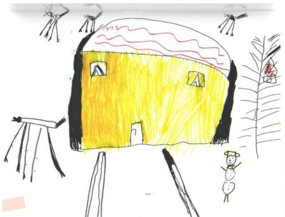
Analiza crteža učenika bez teškoća

Crtež je dosta tmuran. Odnos veličina nije proporcionalan. Na crtežu su prikazane ptice kojih nema u vrijeme zime. Ne koristi racionalno boje. Možda ne voli zimu, pa ju je tmurno prikazala. Linije su jasne, ne postoji osjećaj za volumen. Prostorno je sve pokrila, vidi se osjećaj za prostor. Nedostatak detalja i kreativnosti.