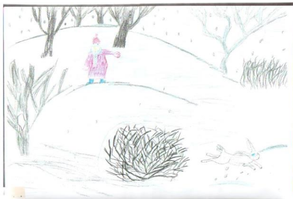
Analiza crteža učenika s lakom mentalnom retardacijom

Kreativan i maštovit crtež. Detalji izraženi i dovršeni. Valovitim linijama prikazao je vedrinu i mekoću crteža, ritam te prostor. Čak je zeca prikazao u pokretu tako da se osjeća volumen. Dječak je prikazao drvećem iza – ispred. Racionalno korištenje boja.