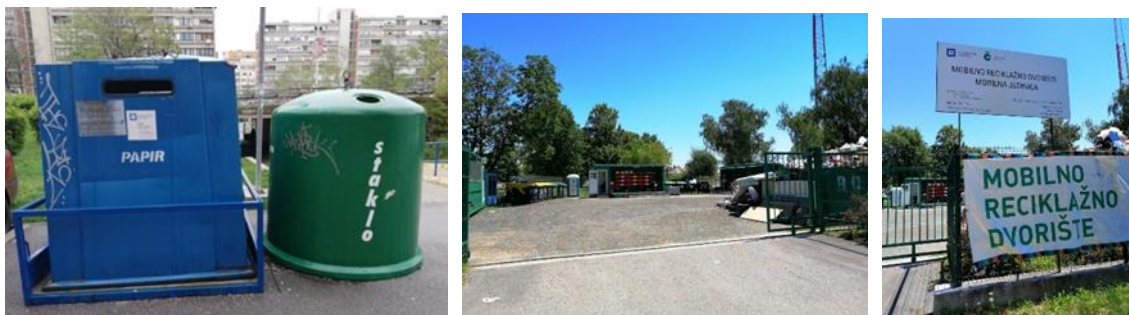
Slika 4. Spremnici i reciklažno dvorište