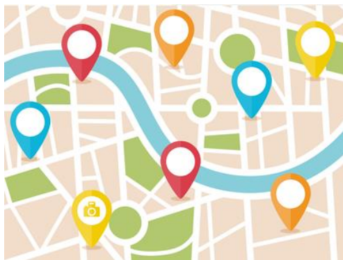
Slika 2. Primjer oznaka Geo-tagiranja

Učenici će u okviru nastavnih aktivnosti dizajnirati geolokacijske oznake za vrstu eko spremnika koja bi svojim dizajnom i bojom upućivala na mjesto i vrstu spremnika, ali i drugih mogućih nepoželjnih odlagališta otpada u okviru kvarta. U realnom vremenu učenici će dodavati i opisivati prikupljene i obrađene podatke (geotagiranje) te pružati zajednici ažurne informacije iz zajedničkog ekosustava. Građani će imati uvid u prikupljene podatke kroz web-korisničke aplikacije i mobilnu aplikaciju #ekokvart.