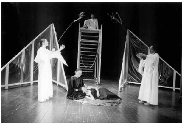
Antun Kanižlić Sveta Rožalija , režija Jasmin Novljaković, Gradsko kazalište Požega, 2019. Na slici: Suvremena scenografija i stilizirani kostimi uz stari jezik i priču o važnosti spasa duše. Foto: Arhiva kazališta. Objavljeno s dopuštenjem kazališta.