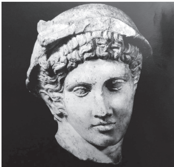
Slika 6. Glava Merkura u Ashmolean Museumu u Oxfordu (preuzeto: Glučina, 2013: 38).