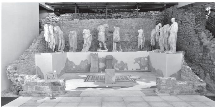
Slika 4. Pogled na Augustej prezentiran in situ u današnjem Arheološkom muzeju Narona (foto: P. Domines Peter).

Neposredno uz sjevernu stranu Augusteja otkrivena je monumentalna građevina za koju se smatra da je bila kurija, gradska vijećnica u kojoj se sastajalo ordo decurionum . Istraživanjima, koja su bila ograničena na polovicu građevine, otkrivena je popločana površina omeđena sa zapadne strane apsidom te zidovima koji su bili ožbukani ili obloženi mramornim panoima, a u podnožju njih bile su smještene kamene klupe. Upravo su kamene klupe, kojih je sigurno bilo i više no što je pronađeno, snažan pokazatelj da je riječ o građevini koja je bila kurija, a njezina lokacija u blizini Augusteja i gradskog foruma dodatno osnažuje tu atribuciju (Marin, 2017: 78-81).