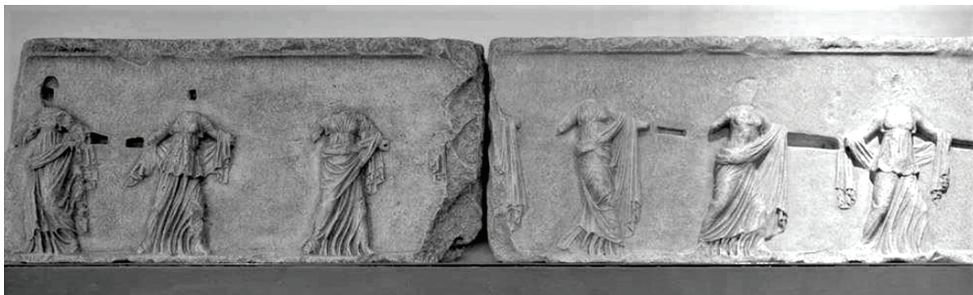
Slika 2. Reljef s prikazom plesačica iz Narone

(Slika 2.) koji se datira u kasno helenističko doba i morao je biti isklesan u lokalnoj radionici kojoj nije bila strana helenistička umjetnička tradicija (Cambi, 1980: 134). U istom kontekstu vrijedi spomenuti i tri nadgrobnne stele helenističkog tipa, među kojima su dvije sa natpisima koje spominju Italike (Kirigin, 1980: 169-171). To bi ukazivalo da su i doseljenici u kasno republikansko doba koji su govorili latinskim jezikom prihvatili lokalne tradicije helenističke inspiracije koje su očito bile snažno razvijene. Međutim, vrijedi posebno naglasiti činjenicu da do sada u poznatom korpusu epigrafskih spomenika iz Narone nije poznat ni jedan natpis pisan grčkim jezikom datiran u helenističko razdoblje što otežava teoriju o stalnoj prisutnosti Grka, ali i pokazuje da se još od rana riječ o snažno romaniziranoj sredini.