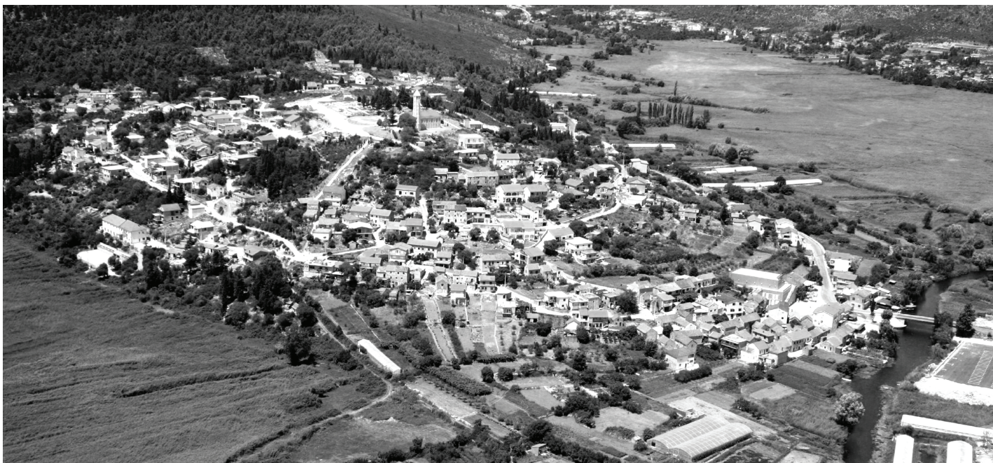
Slika 1. Pogled iz zraka na današnji Vid kod Metkovića – prilog razumijevanju prostornog konteksta antičke Narone